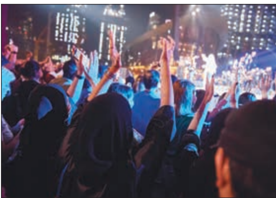
تفاعل جماهيري خلال الحفل

احتفلت دولة الإمارات العربية المتحدة أول من أمس بمناسبة «سنة لننتقل» إلى إكسبو 2020 دبي بفعاليات مبهره في الإمارات السبع جسدت بعضاً من ملامح ما سيشهده الحدث الأروع في العالم. وتألقت النجمة العالمية ماريا كاري ونجم العرب حسين الجسمي، سفير إكسبو 2020 دبي، في الاحتفالات التي أقيمت في حديقة البرج في وسط مدينة دبي على مدى ساعة قدما خلالها أروع ما لديهما للجمهور التي احتشدت للمشاركة في هذه المناسبة. وتحولت جميع الأنظار إلى برج خليفة بحلول الساعة 20:20 (الثامنة وثلاث مساءً) لمشاهدة عرض الضوء والألعاب النارية التي انطلقت إيذاناً بالعد التنازلي للسنة الأخيرة السابقة على انطلاق إكسبو 2020 دبي، الحدث الأضخم على الإطلاق في العالم العربي، والذي سيقام على مدى 173 يوماً مليئة بالإلهام والابتكار والمرح لجميع أفراد الأسرة. وأقيمت فعاليات متميزة أيضاً بالتزامن مع احتفالات دبي من الساعة الخامسة إلى العاشرة مساءً في الإمارات الست الأخرى. أقيمت الاحتفالات في متحف اللوفر أبوظبي، وواجهة المجاز المائية في الشارقة، ومتحف عجمان، وكورنيش أم القيوين، وكورنيش القواسم في رأس الخيمة، وقلعة الفجيرة. وبيئت احتفالات الإمارات السبع مدى فخر الناس وحماستهم المتزايد لهذا الحدث، في الوقت الذي يجري فيه العمل على قدم وساق للتحضير لاستضافة أول إكسبو دولي يقام في منطقة الشرق الأوسط وأفريقيا وجنوب آسيا. أقيمت الاحتفالات في أجواء مناسبة لجميع أفراد العائلة، وشارك في إحيائها عدد كبير من الموسيقيين