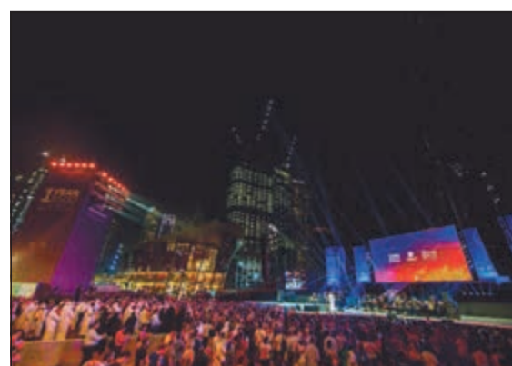
حديقة البرج في وسط مدينة دبي