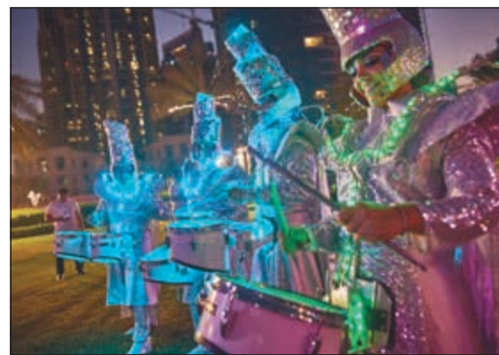
عروض ترفيهية رافقت الحفل