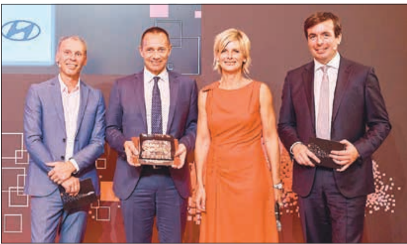
ممثل «هيونداي موتور» متسلماً للجائزة

للشحن بالقياس الكهربائي، والمركبات العاملة بخلايا وقود الهيدروجين». واستطاعت هيونداي موتور أن تفوق أقرب منافسيها في فئة «العلامة التجارية الكبيرة الأكثر ابتكاراً»، بما مجموعه 43 نقطة مؤشراً، وذلك بفضل ابتكاراتها في أنظمة القيادة البديلة. وقال بيان لجنة التحكيم في الجائزة إن أحد الأسباب وراء ذلك هو «النسبة العالية من الابتكارات (حوالي 18٪) التي يمكن أن تعزى إلى أنظمة القيادة البديلة». وتشمل هذه الابتكارات مركبة كونا الكهربائية، من المركبة الرياضية الصغيرة الأبعد في فئة المركبات الرياضية الصغيرة متعددة الاستخدامات، واعتبرت لجنة التحكيم كذلك أن المركبة نيكسو «ابتكار مهم للغاية»، فأثرت أيضاً في المحرك العامل بخلايا الوقود، بشاشة تعرض النقطة العمياء للمركبة، ووظيفة المساعدة في القيادة على الطرق السريعة، ووظيفة ركن المركبة عن بعد، والتي تمكن المركبة للمرة الأولى في فئتها، من ركن السيارة في موقفها ركنًا تاماً وتلقائياً.