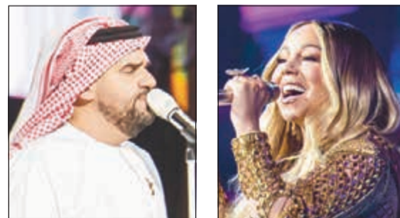
مارايا كاري وحسين الجسمي تألقا في الحفل