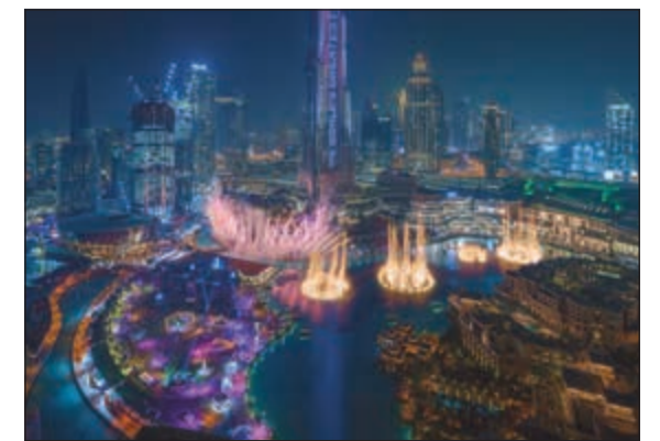
جانب من العروض الضوئية