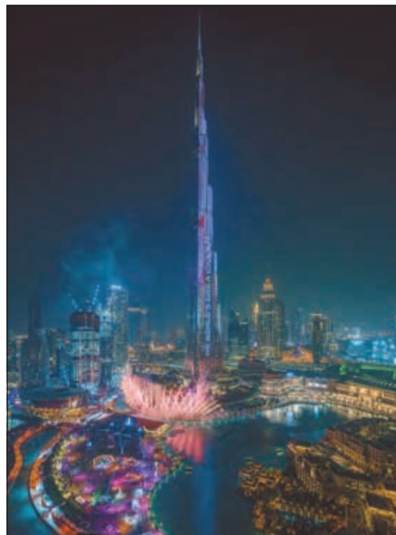
برج خليفة اجتذب الأنظار