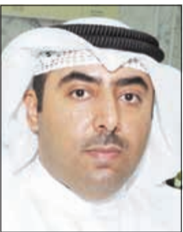
أشاد رئيس الطيران المدني الشيخ سلمان الحمود

الكويت دفعا باتجاه الانتهاء منها بأسرع وقت ممكن وتذليل جميع ما تواجهه من معوقات. وإذ تنتهز هذه المناسبة لنعتبر لكم عن شكرنا وتقديرنا لاهتمامكم، فإننا نأمل مزيداً من التعاون المشترك بين المجلس البلدي والإدارة العامة للطيران المدني لما فيه خير وتقدم بلدنا الكويت الحبيب. سائلين المولى أن يوفقنا جميعاً لخدمة وطننا الحبيب بقيادة صاحب السمو وسمو ولي العهد وسمو رئيس مجلس الوزراء.