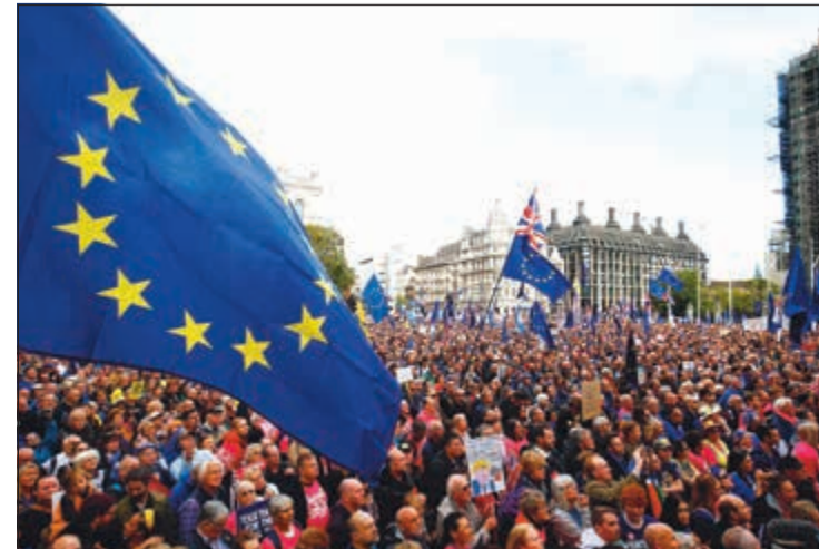
آلاف البريطانيين المؤيدين للبقاء في الاتحاد الأوروبي يتظاهرون تزامناً مع جلسة تاريخية للبرلمان أمس

عواصم - وكالات: قبل أقل من 12 يوماً على الموعد المفترض في 31 الجاري، عادت أزمة خروج بريطانيا من الاتحاد الأوروبي «بريكست» إلى المربع الأول، حيث أرحب مجلس العموم البريطاني التصويت، وأقر أمس تعديلاً يلزم رئيس الوزراء بوريس جونسون بالتفاوض مع بروكسل على إرجاء هذا الموعد، وإتاحة مزيد من الوقت للنواب لمناقشة الاتفاق الذي أبرمه جونسون مع بروكسل الخميس الماضي، غير أن رئيس الوزراء سارع إلى إعلان رفضه. وقال: «لن أتفاوض على التأجيل مع الاتحاد الأوروبي ولا يلزمي القانون بذلك». وتابع قائلاً: «إن المزيد من التأجيل سيكون مضرًا لهذه البلاد وسيفتتلك الاتحاد الأوروبي وضارًا بالديمقراطية». وتزامن ذلك، مع تظاهر عشرات آلاف البريطانيين للدعوة إلى إجراء استفتاء ثانٍ ونهائي على «بريكست». التفاصيل ص 26