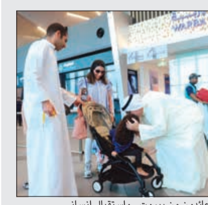
عائدون من بيروت... واستقبال إنساني

تنهش جيب اللبناني الذي لم يعد يحتمل غلاء المعيشة والبطالة وسوء الخدمات العامة. وأغلق محتجون في جنوب وشرق وشمال البلاد الطرق وأحرقوا إطارات سيارات وتظلموا مسيرات في الشوارع. غير أنه، وبحسب مصادر مطلعة لـ «الأنباء»، تبلغ رئيس مجلس الوزراء سعد الحريري من الدول العربية والغربية، خصوصاً أعضاء