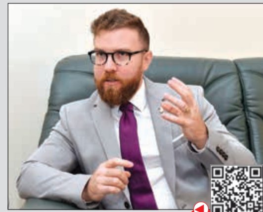
السفير الهنغاري د.اششقان شوش (متين غوزال)