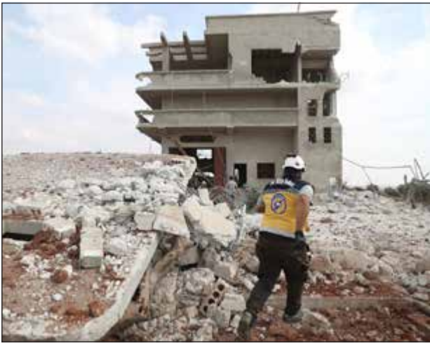
على تفتتاح بريف ادلب

وكالات: ساد الهدوء الحذر منطقة شمال شرق سورية، رغم الإخراقات المصدودة التي تخللت الإعلان عن تعليق عملية «بنع السلام» التركية ضد قوات سوريا الديمقراطية (قسد). ومع انقضاء يومين من المهلة أمس، لم تكن «قسد» قد أخلت أياً من مواقعها، وسط اتهامات بترديدات متبادلة مع أنقرة. فقد هدد الرئيس رجب طيب أردوغان باستئناف الهجوم. وقال «وإذا لم ينجح الاتفاق لن ننتظر كما في السابق، وسنواصل العملية من حيث توقفنا عند انتهاء الـ 120 ساعة ونستمر في سحق رؤوس الإرهابيين»، في إشارة إلى المسلحين الأكراد. في المقابل، اتهم قائد «قسد» مظلوم عبيد تركيا بمنع انسحاب مقاتليه من مدينة رأس العين، تنفيذاً لاتفاق وقف إطلاق النار الذي ترعاه واشنطن، وجدد دعوتها للبقاء في سورية «ليستمر التوازن». وقال «نريد أن يكون هناك دور أميركا في سورية، لا أن يتقرد الروس والآخرين بالساحة».