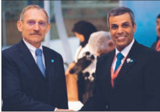
د. خالد الفاضل مع وزير الداخلية والمعني بشؤون المياه الهنغاري

فينا - كونا: أكد وزير النفط ووزير الكهرباء والماء د. خالد الفاضل أن الكويت تسعى بشكل متواصل إلى تحسين وتطوير الإستراتيجيات والخطط الخاصة بالمياه والمحافظه عليها. جاء ذلك في تصريح لـ «كونا» على هامش مشاركته في مؤتمر المياه العالمي 2019 الذي يعقد تحت شعار «الحد من أزمة المياه» في بودابست.