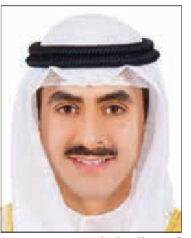
الشيخ ثامر الجابر

البلدين الشقيقين. وأضاف أنه استمع أثناء تقديم أوراق اعتمادها إلى توجيهات العاهل البحريني القيمة التي تحمل الكويت في قلبه وما يخدم مصالح البلدين والشعبين الشقيقين.