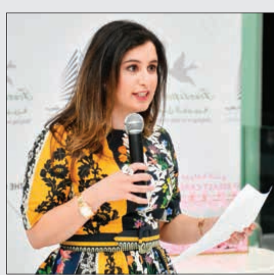
الشيخة هيا على سالم الصباح

قطينة الطبي وهي مبادرة نشكر كل من شارك وأسهم فيها من أجل تقديم خدمة إيجابية للمريضات. بدورها تحدثت المتعافية من السرطان مرتين الناشطة