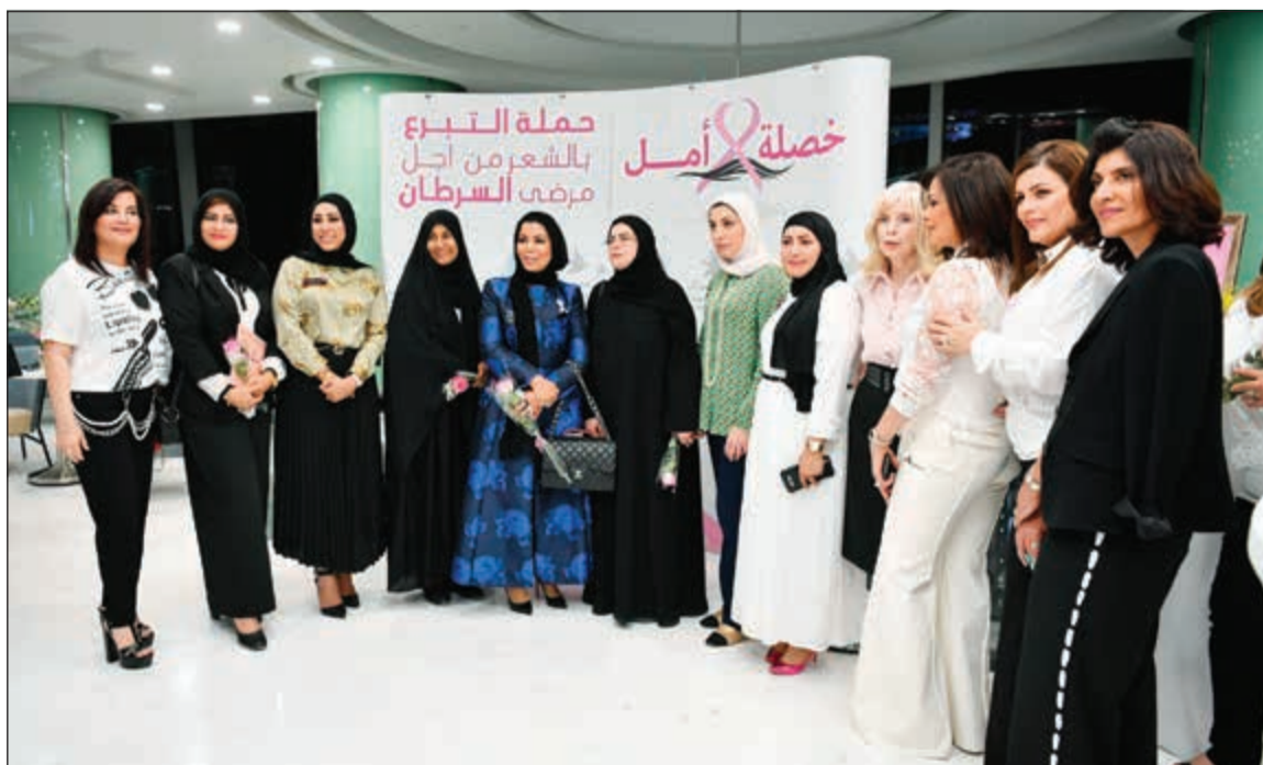
جانب من الحضور بالفاعلية