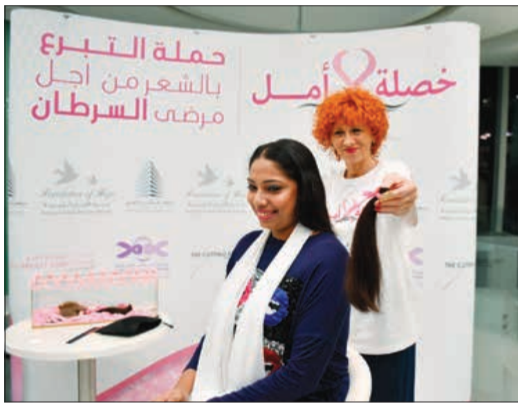
قص شعر إحدى المتبرعات