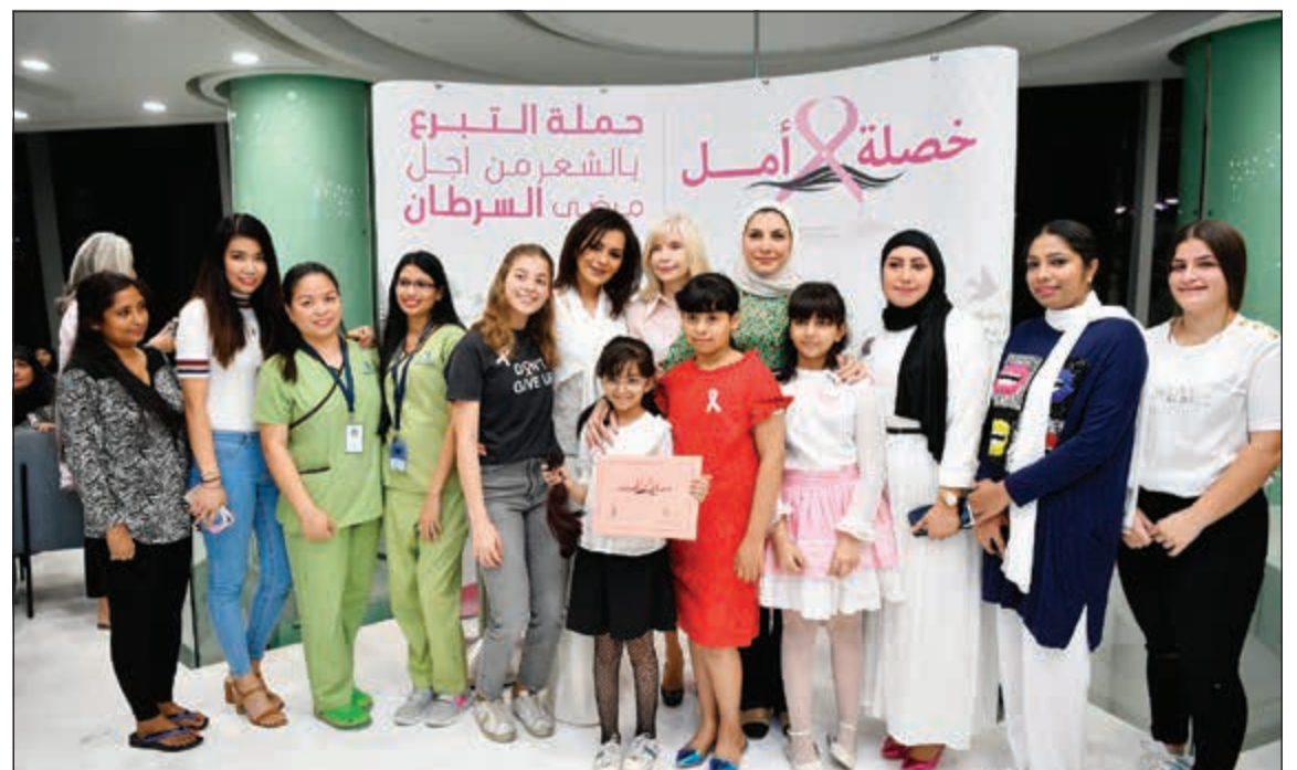
السي قطينة مع عدد من الفتيات اليافعات من المتبرعات بالشعر والحضور