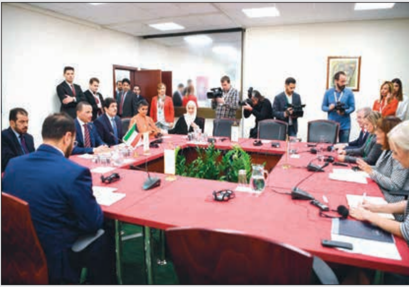
جانب من المباحثات بين الجانبين