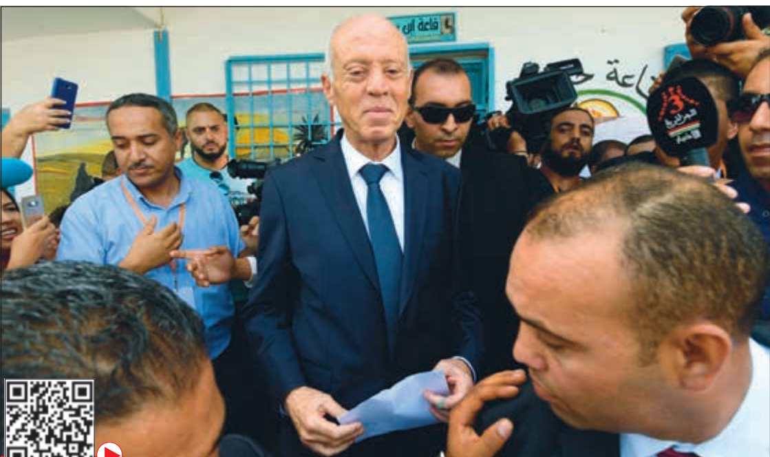
قيس سعيد مدليا بصوته بأحد مراكز الاقتراع امس

ودعى أكثر من 7 ملايين ناخب إلى الإدلاء بأصواتهم في مراكز الاقتراع، التي تواجد بها عدد أكبر نسبيا للناخبين خلال الساعات الأولى، بالمقارنة مع الانتخابات الثنائية التي جرت الأحد قبل الماضي. ويشمل العدد الإجمالي للمسجلين في السجلات الانتخابية 49٪ من النساء و35٪ من الشباب ما بين 18 و35 سنة وفق إحصائيات الهيئة العليا المستقلة للانتخابات. ويتابع 13 ألف ملاحظ من منظمات المجتمع المدني من بينها 450 من الخارج الانتخابات التي تتميز بحضور كبير لمفلي الأحزاب الذين أسندت لهم الهيئة العليا المستقلة للانتخابات 80 ألف اعتماد. وتعد هذه المرة الثانية التي توجه فيها التونسيون الى مراكز الاقتراع في غضون شهر قبعد الدور الاول للانتخابات الرئاسية شارك التونسيون في الانتخابات التشريعية وامس، صوتوا في الدور الثاني لحسم الرئاسة.