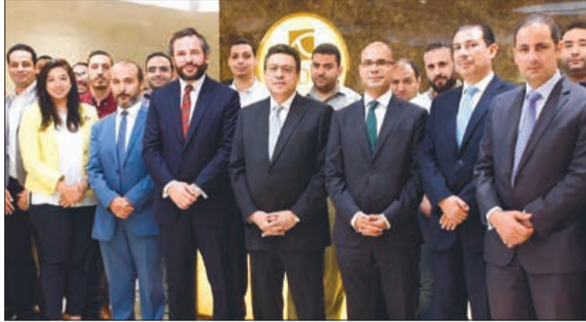
السفير القونى خلال زيارته لمقر الشركة في الكويت

وأضاف نجم أن السفير القونى بحث مع المسؤولين في الشركة سبل تعزيز استثماراتهم في مصر، مشيراً إلى أن «مدن الأهلية» دخلت السوق المصري عام 2015 بتأسيس شركة أولاد دايموند مصر