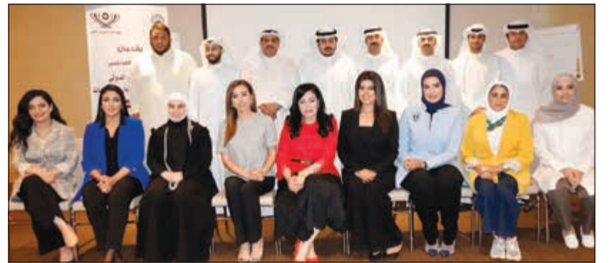
جانب من المشاركين في الدورة