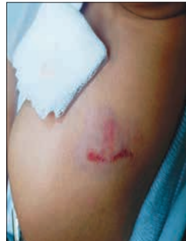
العضة التي تلقاها الشقيق الأصغر في كتفه اليسرى وتسببت في إحالته إلى «السارية»