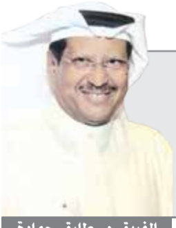
الفريق م. طارق حمادة

الوزراء ووزير الداخلية الشيخ خالد الجراح. خلال استقبال معالي الوزير للمقدم صالح الراشد بحضور وكيل وزارة الداخلية المساعد لشؤون المرور اللواء جمال الصايغ بعث الشيخ خالد الجراح برسائل شديدة الوضوح، أولاً ان ضباط وضباط الصف الداخلية خط أحمر ما داموا ينفذون القانون على الجميع بمسطرة واحدة وهم العيون الساهرة للوطن.