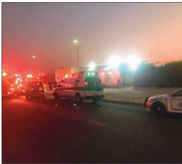
سيارات الإسعاف والإطفاء في محيط السجن المركزي