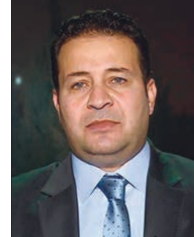
د. محمد أبو رمان

عمان - كونا: أكد وزير الثقافة ووزير الشباب الأردني د. محمد أبو رمان أن الشعب الكويتي «من أقرب الشعوب للأردن»، واصفاً ما حدث من تهافتات «غير مسؤولة» أثناء مباراة منتخبى البلدين بـ«الاستفزازية». وقال أبو رمان في صفحته الرسمية على مواقع التواصل الاجتماعي إن الأردن يرفض هذه التهافتات، مشيراً إلى أنها «لا تمثله كشعب ولا يقبل بها ونسيء لموقفه تجاه الشعب الكويتي الشقيق». وأضاف «طلما وقف الأشقاء في الكويت مع الأردن وكانوا أهلاً وإخواناً لنا.. احتضنوا أبناءنا في الغربية وفتحوا لهم البيت وعاملوهم على أفضل ما يكون، والشعب الكويتي من أقرب الشعوب لنا». وأوضح أنه بعد انتهاء المباراة مباشرة عبر كثيرون من أبناء الشعب الأردني على مواقع التواصل الاجتماعي عن «الموقف الحقيقي» بإدانة تلك