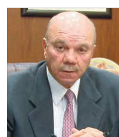
رئيس مجلس الأعيان فيصل الفايز

يسهم في البناء على العلاقات «التاريخية المتجذرة»، بما يصب في مصلحة البلدين والشعبين الشقيقين ويخدم مختلف قضايا الأمة العادلة. وأكّد أن الأردنيين «يتمنون عالياً» مواقف صاحب السمو الأمير الشيخ صباح الأحمد الداعمة للأردن خاصة في ظل الظروف الاقتصادية الصعبة