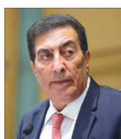
رئيس مجلس النواب عاطف الطراونة

التي يواجها الأردن «جراء ما يحيط بنا من أزمات» مضيفاً أن الكويت وقيادتها وشعبها كانوا على الدوام إلى جانب الأردن وحرصون على أمنه واستقراره. وفي الإطار ذاته، استنكر مجلس النواب الأردني محاولة المساس بروابط «الأخوة العميقة» التي تربط البلدين