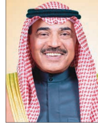
الشيخ صباح الخالد

عمان - «كونا» - نجحت جهود المسؤولين في المملكة الأردنية الهاشمية الشقيقة في احتواء غضب أهل الكويت بعد التهافتات المسيئة التي أطلقها مجموعة من الأشخاص أثناء المباراة بين منتخبي البلدين يوم الخميس الماضي في إطار التصفيات الآسيوية. وقد خرج المسؤولون بداية من رؤساء مجالس الوزراء والنواب والأعيان مروراً بعدد من الوزراء وكبار الشخصيات لإعلان استنكارهم لتلك التهافتات، والتأكيد على العلاقات الراسخة والوطيدة والمتجذرة بين البلدين الشقيقين على مختلف المستويات، مؤكداً أن تلك الإساءات جاءت من حفنة مندسة تسعى إلى بث الفرقة والخلاف بين البلدين، إلا أن العلاقات المشتركة أقوى من أي محاولات رخيصة. وقد تزامنت هذه التصريحات بإجراءات فعلية على أرض الواقع إذ لقي الأمن العام الأردني القبض يوم أمس الأول على شخصين ممن قاموا بإطلاق العبارات المسيئة، وباشرت الأجهزة المعنية التحقيق معهما على الفور تمهيداً لضبط باقي الأشخاص واتخاذ الإجراءات القانونية بحقهم جميعاً. رئيس الوزراء الأردني د. عمر الرزاز سارع إلى التأكيد على أن تلك الحادثة «ليست من قيم الأردنيين ولا من رابطة الأخوة التي تجمع الأشقاء في البلدين»، مشيراً إلى أن التهافتات في الملعب «إساءة عابثة». وأضاف في تغريدة على