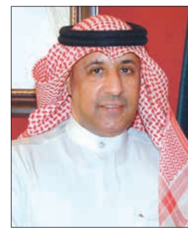
السفير عزيز الديحاني

عمان - «كونا»: أكد سفير الكويت لدى الأردن عزيز الديحاني «متانة ورسوخ» العلاقات بين الكويت والأردن، مشدداً على أنها أكبر بكثير من أن تنال منها تهافتات «غير مسؤولة» ومحاولات «رخيصة» للمساس بها. وثنم الديحاني في تصريح له «كونا» ردة الفعل الأردنية الرسمية والشعبية التي استهجت هذا السلوك ورفضته بشكل قاطع من «فئة» من الجماهير التي حضرت مباراة المنتخبين، لافتاً إلى أن ردة الفعل محل «تقدير واعتزاز» لدى الكويتيين. وأشاد بما صدر من مجلس النواب الأردني من بيان لرفض المساس بالكويت وشعبها واستنكار رئيس مجلس الأعيان الأردني فيصل الفايز لهذه الإساءة. كما أشاد بحرص المسؤولين في الاتحاد الأردني لكرة القدم على اتخاذ الإجراءات الكفيلة بمحاسبة «المسيئين» وهو ما يعكس مكانة الكويت «الكبيرة» لدى الأردن ويؤكد. وأضاف أن الكويت كانت ومازالت «منارة» للسماحة والحكمة ومظلة حاضنة لكل الأشقاء العرب» من منطلق الأخوة ووحدة المصير