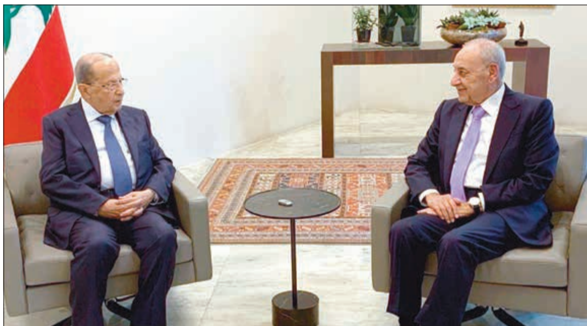
الرئيس العماد ميشال عون مستقبلا رئيس مجلس النواب نبيه بري في قصر بعبدا

وبالمنااسبة، شاركت 70 جمعية تجارية بالإعتصام لساعة واحدة أمام مبنى غرفة التجارة والصناعة احتجاجا على كل ما يستهدف القطاع الخاص من ضرائب اضافية محتملة مع دولار اميركي يعز الوصول اليه بسهولة. بدورها، قررت نقابية اصحاب المخازن (الافران) الاضراب العام يوم الاثنين المقبل كإنداز للمعنين، حيث أعلن رئيس النقابية كاظم ابراهيم أن اصحاب الافران لا يستطيعون مواصلة بيع الخبز بالليرة وشراء الطحين بالدولار، على اسم ان تلقى صرختهم أناانا مصغية.