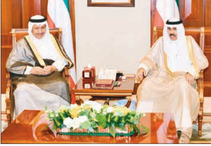
سمو نائب الأمير مستقبلاً سمو الشيخ جابر المبارك