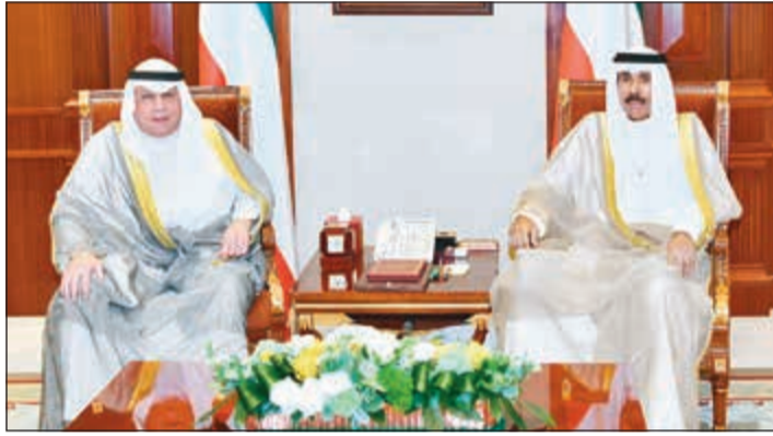
سمو نائب الأمير مستقبلاً الشيخ خالد الجراح

سموه التقى الأحمد وزيدان والصالح والكندي