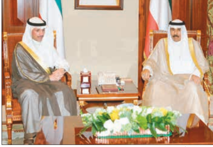
سمو نائب الأمير وولي العهد الشيخ نواف الأحمد مستقبلاً مرزوق الغانم

رئيس مجلس الوزراء ووزير الداخلية الشيخ خالد الجراح، واستقبل سمو نائب الأمير وولي العهد سفيرنا لدى جمهورية الصين الشعبية الصديقة السفير سمح جوهر حيات.