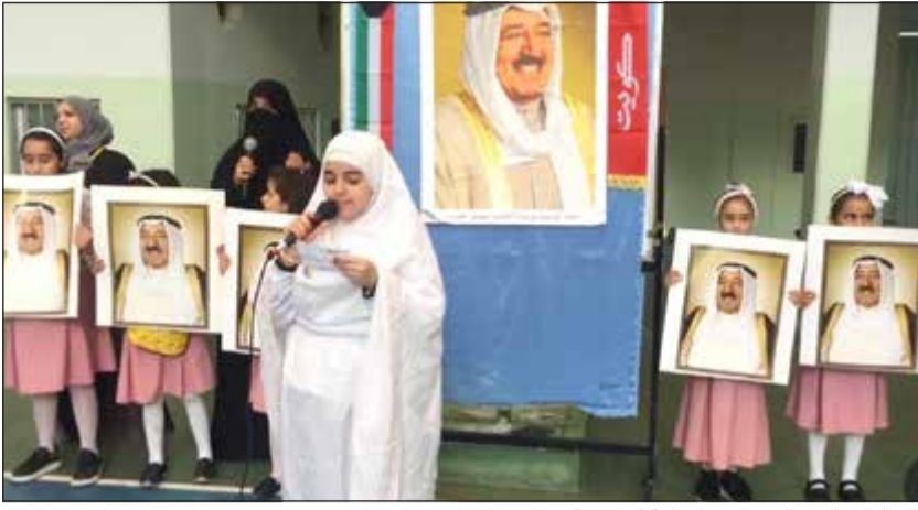
الدعاء لصاحب السمو في الإذاعة المدرسية