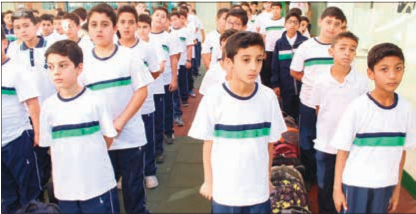
طلبة مدارس النجاة عبروا عن حبهم لصاحب السمو

بتوجيهات من مدير عام مدارس النجاة عبدالعزيز المحمد نظمت جميع مدارس النجاة متمثلة في طلابها وطالباتها وأعضاء الهيئتين الإدارية والتعليمية حملة الدعاء والتضرع إلى الله سبحانه وتعالى بشكل يومي من خلال الإذاعة المدرسية في جميع مدارسها، بأن يمن الله سبحانه وتعالى بالشفاء العاجل على قائد الإنسانية صاحب السمو الأمير الشيخ صباح الأحمد، وأن يلبسه المولى عز وجل ثوب الصحة والعافية وأن يطبل في عمره ويحفظه وأن كل شر وسوء وأن يجزيه عن أمته ووطنه خير الجزاء، وأن يجعله ذخراً للأمتين العربية والإسلامية، وأن يعيده إلى أرض الكويت الحبيبة سالماً غانماً معافى. وفي سياق متصل، أكد عبدالعزيز المحمد أن مدارس النجاة حريصة كل الحرص على المشاركة المجتمعية الفعالة في جميع المناسبات الوطنية وعلى جميع المستويات من خلال نخبة من المعلمين والمعلمات الذين يتم اختيارهم بعناية فائقة.