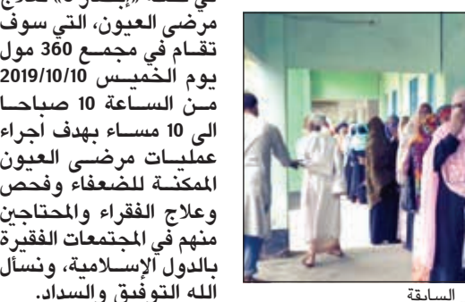
عدد من المستفيدين من حملة إبصار السابقة

ما آخر الاستعدادات الجارية لحملة إبصار الثالثة؟ ● العمل المؤسسي والجماعي المنظم والمتابعة الجيدة أحد أسرار نجاح المشاريع بالنجاة الخيرية،