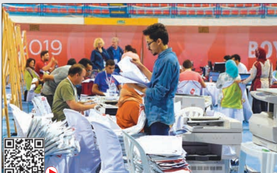
فرز الأصوات في الانتخابات التشريعية التونسية

217 نائبا. وحل ثالثاً بحسب الاستطلاعين «اتلاف الكرامة» برئاسة المحامي المحافظ سيف الدين مخلوف الذي سيحصل على ما بين 17 و 18 مقعداً. كما كشفت النتائج الأولية الرسمية قوتى جديدة ستكون مؤثرة في مفاوضات التحالف أو في المعارضة مثل «الحزب الدستوري الحر» الذي يمثل واجهة النظام القديم قبل الثورة، و«اتلاف الكرامة» اليميني المحافظ إلى جانب أحزاب الوسط مثل «تحيا تونس» لرئيس الحكومة يوسف الشاهد و«التيار الديمقراطي» و«حركة الشعب». وتراوح حصة كل حزب من هذه الأحزاب ما بين 14 و 18 مقعداً في البرلمان. وتندرج هذه التقديرات، بمشهد برلماني مشتمل سيكون من الصعب خلاله تشكيل تحالفات. هذا وتمكن «الحزب الدستوري الحر» مؤسسته عبير موسى التي ترفع لواء الدفاع عن نظام الرئيس الراحل زين العابدين بن علي، من تكوين قاعدة مكنتها من نيل 74 من الأصوات. وقالت عبير موسى عقب ظهور نتائج الاستطلاعات «الدماسرة دخلوا التاريخ من الباب الكبير ولأول مرة بعد ثورة 2011 مجلس نواب الشعب