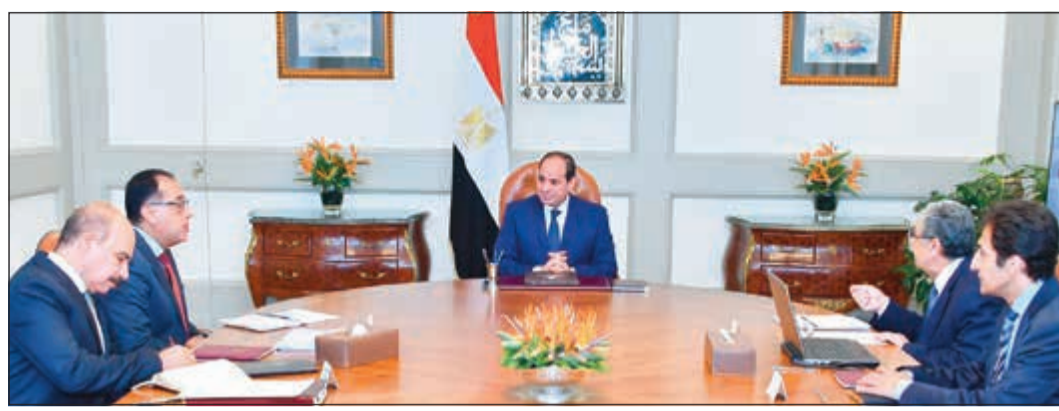
جانب من اجتماع الرئيس عبد الفتاح السيسي مع رئيس الوزراء ووزير الكهرباء والطاقة المتجددة