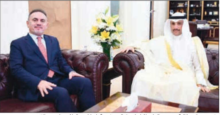
رئيس مجلس الأمة مرزوق الغانم أثناء استقباله سفير ألبانيا لدى البلاد ساميريم بالا

استقبل رئيس مجلس الأمة مرزوق الغانم بمكتبه سفير ألبانيا لدى البلاد ساميريم بالا.