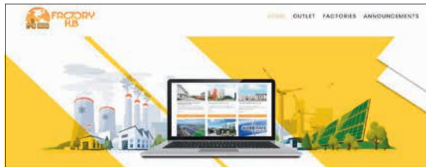
الصفحة الرئيسية للموقع الإلكتروني

ما الذي يتميز به موقع Factory Hub عن المواقع المنافسة؟ ● هناك الكثير من المواقع الخاصة بالبيع والشراء، لكنها ليست كموقعنا لان اغلب منتجاتهم من موردين، اما Factory Hub فمخصص