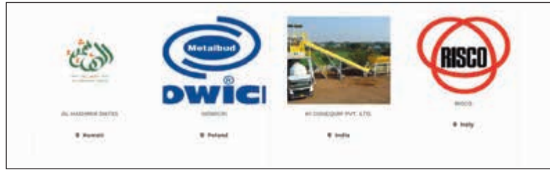
جانب من المصانع