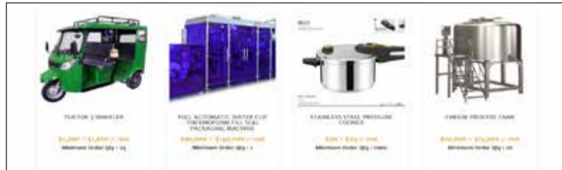
جانب من المنتجات