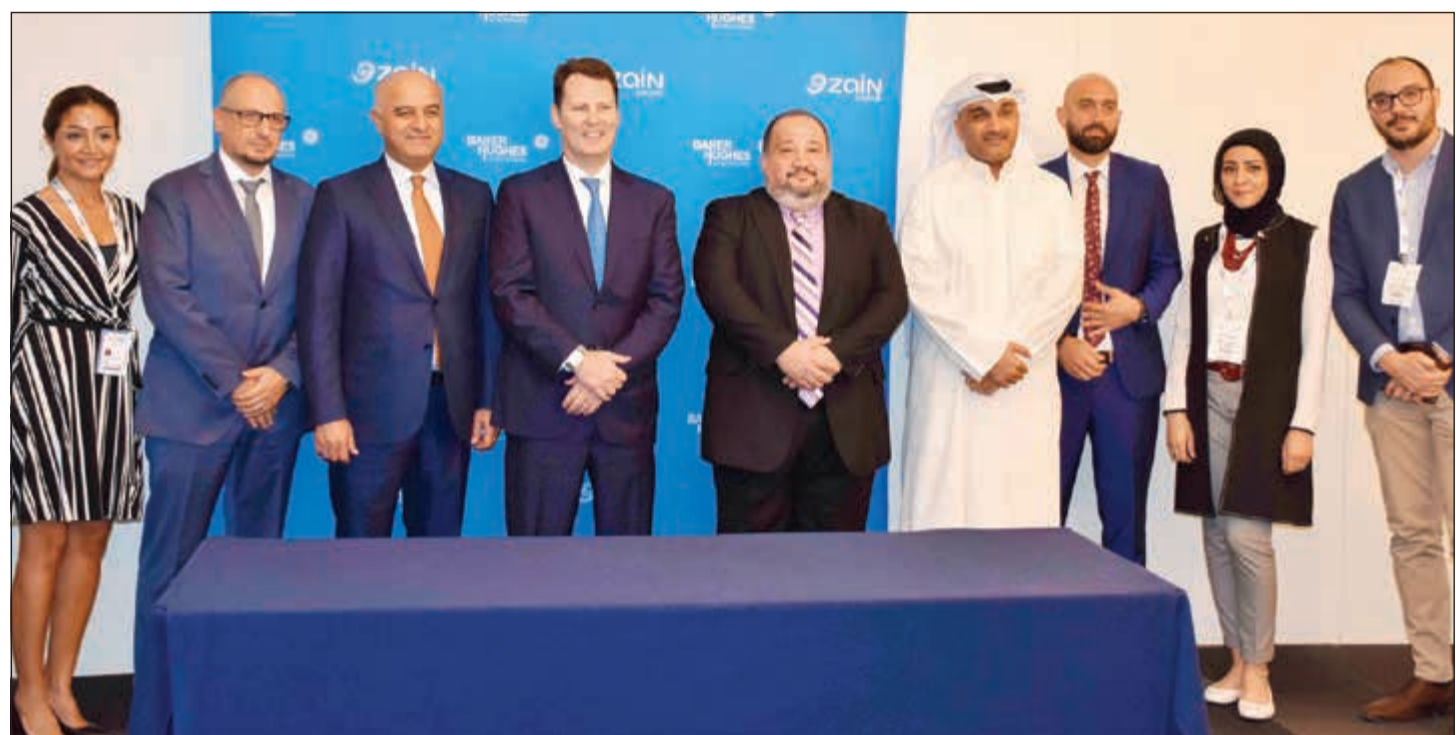
مسؤولو «زين درون» و«بيكر هيوز» في لقطة جماعية

وأضاف الهاشل أن الورشة تتناول جملة من المواضيع المهمة في مجال توقعات السيولة وإدارتها، من بينها طرق قياس حجم السيولة والتنبؤ بحاجتها