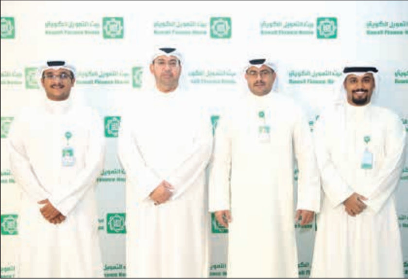
ممثل وزارة التجارة والصناعة مع فريق «بيتك»

تذكرتان على درجة رجال الأعمال وإقامة 5 ليال في فندق 5 نجوم ومنحة نقدية للفائز