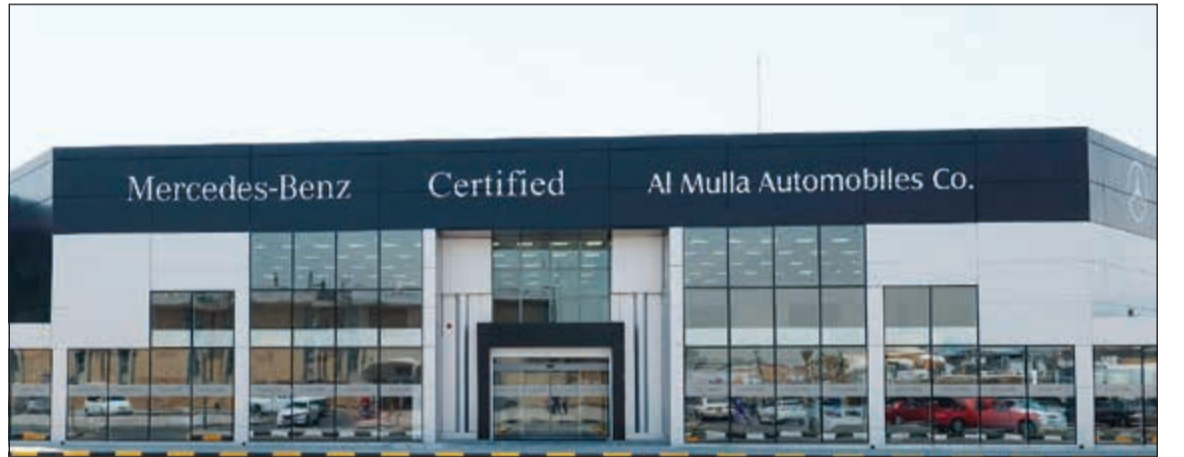
صالة عرض مرسيدس - بنز للسيارات المعتمدة في الأحمدي

كما يقدم مركز الخدمة السريعة «إكسبريس» التي صممتها مرسيدس - بنز لتضمن للعملاء خدمة عالية الجودة في أقصر وقت ممكن، وتشمل باقة «إكسبريس» خدمة الصيانة (1) و (ب)، وتغيير الزيت، وتصليح المكيفات الهوائية، وتغيير الإطارات، وخدمة الفرامل. وتوفر خدمة تغيير الزيت السريعة خدمات تغيير زيت المحرك والفلتير في غضون 30 دقيقة فقط. وتؤكد الملا أوتوموبيلز من خلال افتتاحها لثاني صالة عرض سيارات مرسيدس - بنز المعتمدة ومركز الخدمة في الأحمدي التزامها بتجاه عملائها في الكويت، فهي بذلك توفر لهم مرافق جديدة تمنحهم المزيد من الخبرات والمنتجات والخدمات في مختلف أنحاء الكويت.