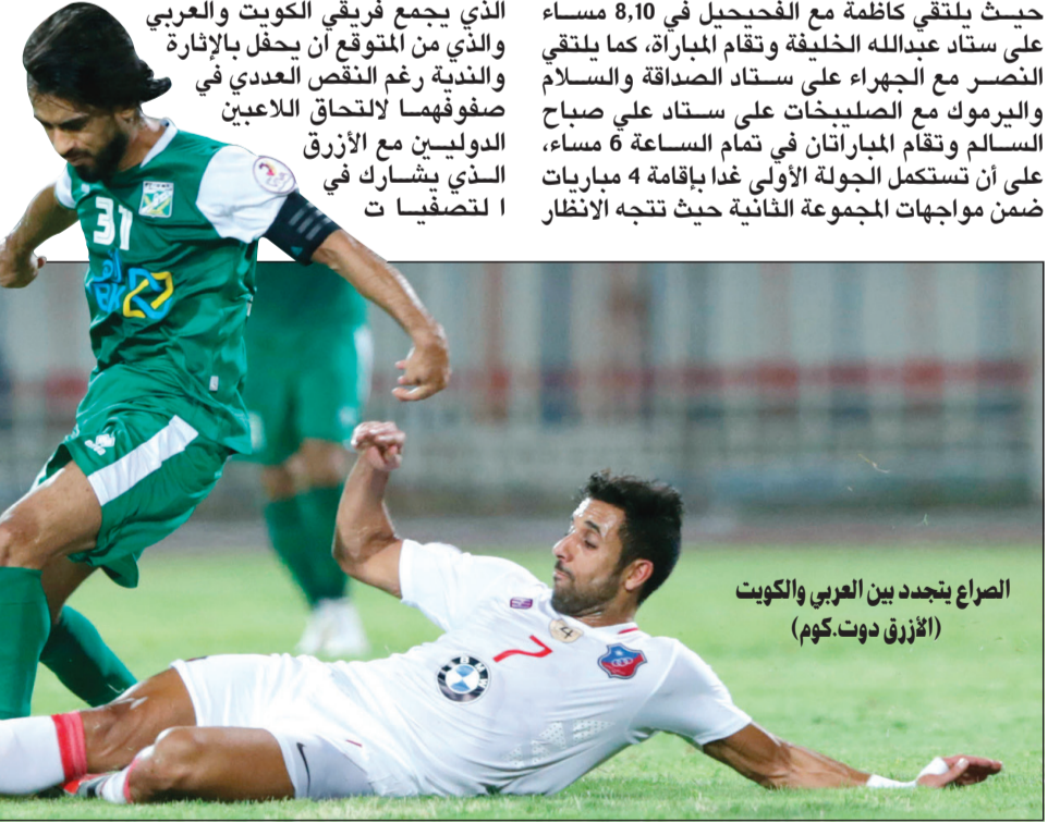
الصراع بين العربي والكويت (الأزرق دوت.كوم)