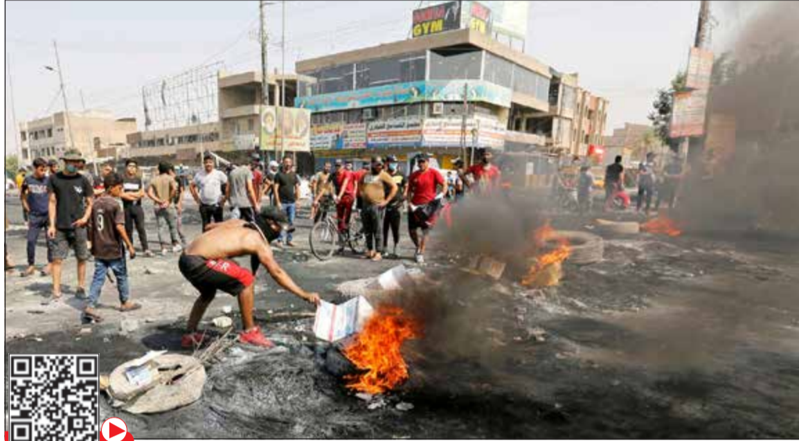
محتجون يشعلون إطارات خلال اليوم الثالث للمظاهرات في بغداد أمس

نحو المحافظات الشمالية بالمغادرة بعد التأكد من هوياتهم». وفي سياق متصل، أعلن مجلس محافظة بغداد تعطيل العمل يوم أمس في كل الدوائر التابعة له، الأمر الذي يسمح لقوات الأمن بتعزيز نفسها وتشديد قبضتها في مواجهة المظاهرات. وبتوازي، قررت الرئاسة الثلاث تشكيل لجنة رسمية للتعامل مع مطالب المظاهرين وإطلاق حوار وطني شامل حول الإصلاح والسعي لتوفير فرص عمل. وأفادت الوكالة الوطنية العراقية للأنباء «ثينا» بأن رئيس مجلس النواب محمد الحلبوسي دعا منسقي المظاهرات إلى حضور جلسة المجلس غداً. وكان رئيس الوزراء عادل عبد المهدي قد فرض حظر