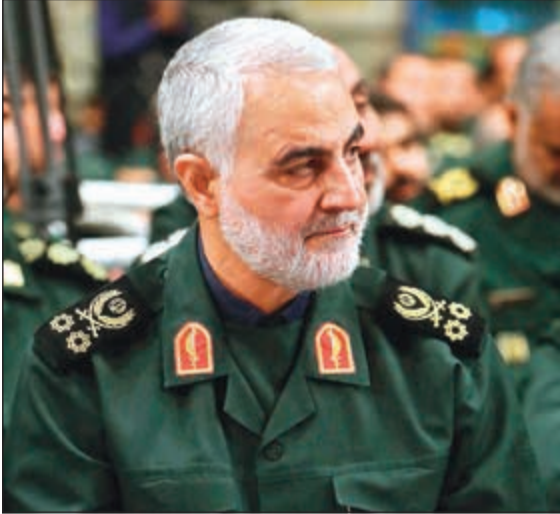
قاسم سليمانى

عواصم - وكالات: أعلن الحرس الثوري الإيراني عن إحباط محاولة لاغتيال قاسم سليمانى قائد فيلق القدس ذراع العمليات الخارجية بالحرس وذلك في مدينة كرمان قبل نحو ثلاثة أسابيع. وقال رئيس جهاز الاستخبارات في الحرس الثوري حسين طائب، إنه «تم إفشال مخطط متورطة فيه المخابرات الإسرائيلية لاغتيال قائد فيلق القدس اللواء قاسم سليمانى، والإلقاء القبض على فريق الاغتيال عبر مخابرات الحرس الثوري».