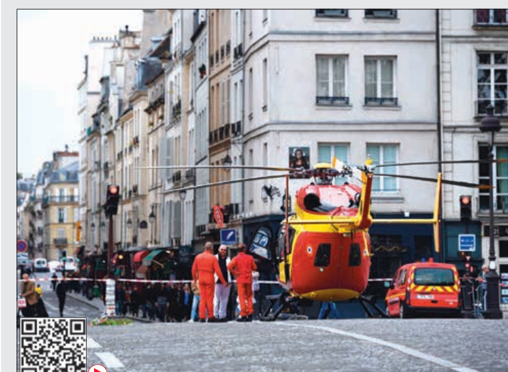
طائرة هليكوبتر للإسعاف الجوي في بونت ماري بالقرب من مقر شركة باريس

إلى فرانسوا مولان النائب العام في الجمهورية الفرنسية. بدورها، كتبت عمدة باريس أن هيدالغو تغريدت فيها «باريس تبكي على الأمن في قتله لاحقاً، في هجوم غير مسبوق داخل هذه المؤسسة». وأضافت في أول تأكيد رسمي لوقوع قتلى «الخسارة كبيرة: عدد من رجال الشرطة فقدوا أرواحهم». وجرى بث رسالة إنذار عبر مكبرات الصوت في قصر العدل في باريس الواقع قبالة مقر الشرطة، وقالت الرسالة «وقع اعتداء في مقر الشرطة والوضع تحت السيطرة»، ولكنها أشارت في الوقت نفسه إلى أن المنطقة «لا تزال تحت المراقبة».