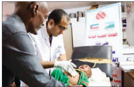
تقديم الرعاية الطبية لأحد الأطفال