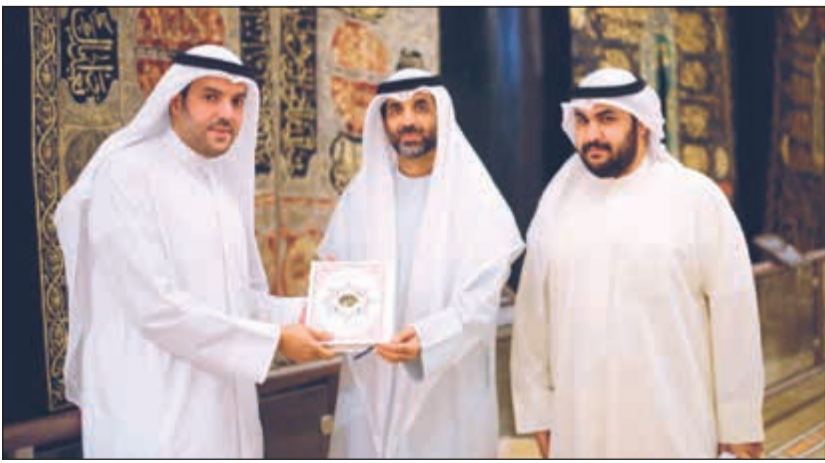
نسخة من مصحف الكويت للمتحف

خبرات إدارة المتحف في التنسيق مستقبلاً مع الهيئة في إطلاق معرض يضم مقتنيات الهيئة من المصاحف التراثية، وفي الختام، أهدت الهيئة نسخة فاخرة من مصحف الكويت التي قامت بطباعته للمتحف.