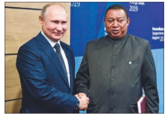
فلاديمير بوتين يلتقي محمد باركيندو على هامش المنتدى الدولي لأسبوع الطاقة في موسكو

وكالات: قال الرئيس الروسي فلاديمير بوتين أمس إن روسيا ستظل طرفا مسؤولا في التحالف بين منظمة أوبك والمنتجين المستقلين من خارجها فيما يعرف بمجموعة (أوبك+)، وأضاف بوتين في منتدى للطاقة في موسكو بحضور وزير الطاقة من السعودية وإيران إن المهتم باستخدام جميع الأدوات المتاحة لتحقيق التوازن في أسواق الطاقة. وصف الرئيس الروسي الهجمات التي تعرضت لها منشآت شركة (أرامكو) السعودية بأنها «عمل هدام» الحق ضرا بالاقتصاد العالمي. وقال بوتين إن الأطراف التي وقفت وراء هذا الهجوم لم تحقق أهدافها، لأن السعودية تمكنت في أسبوع من استعادة قدراتها الإنتاجية بشكل كامل.