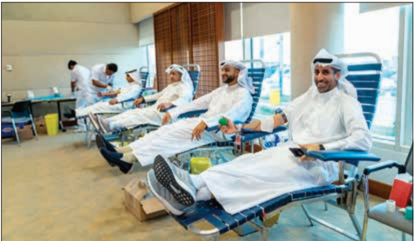
جانب من حملة التبرع بالدم

الإنساني تجاه هذا المبادرة ما هو الا خلق ثقافة التبرع واستمراريتها في المجتمع، ويتجلى ذلك في حملة «السعادة من العطاء»، وهي مبادرة مستدامة للتبرع بالدم لمساعدة المرضى المحتاجين. وشكر الحوطي جميع من شارك وساهم في نجاح هذه الحملة مما يعكس بالإيجاب في دعم خطة القطاع الصحي بالكويت».