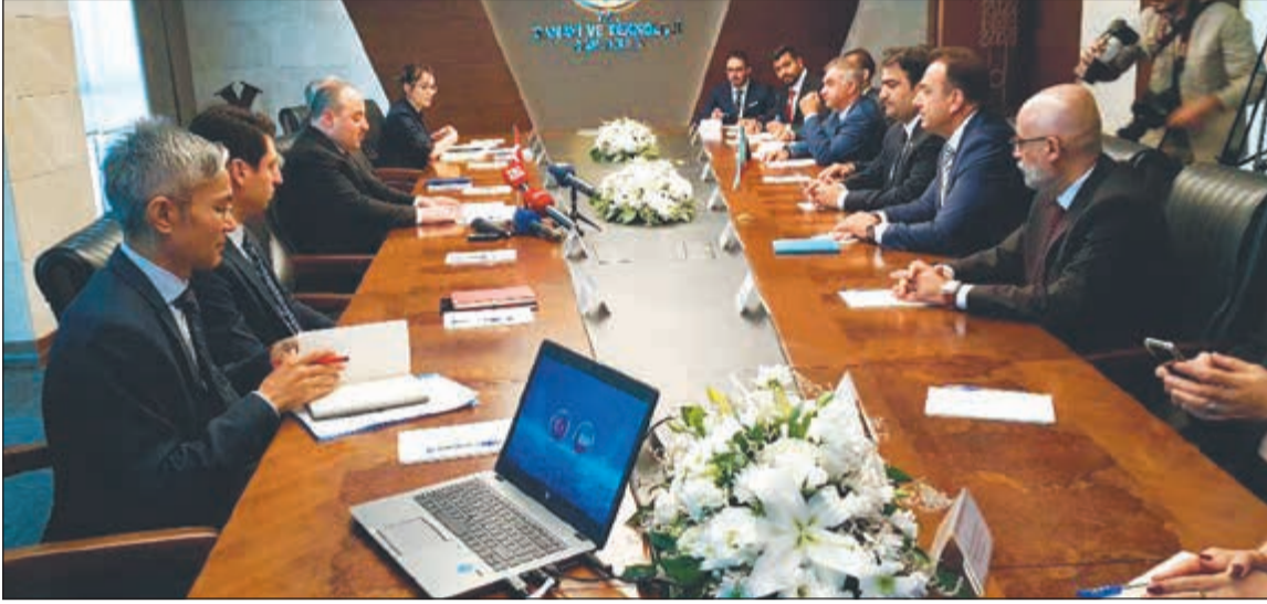
خلال اجتماع وفدي البلدين