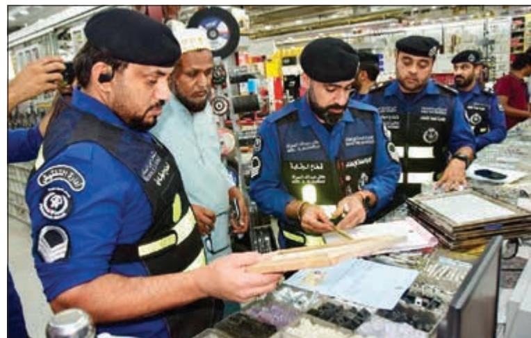
جانب من حملة إدارة الوقاية على كراجات ومخازن ومحلات في «الشويخ الصناعية»