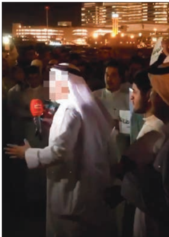
صورة أرشيفية للمتهم خلال ظهوره بالتصوير المتداول

حجزت محكمة الجنائيات أمس الدعوى المتهم بها م.خ بالتحريض على اغتيال مسؤولي الجهاز المركزي لمعالجة أوضاع المقيمين بصورة غير قانونية، وللحكم في الثاني والعشرين من شهر أكتوبر الجاري.