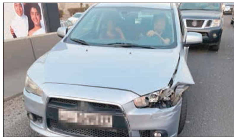
المركبة بعد توقيفها من قبل الضابط وبيدو الوافدان بداخلها