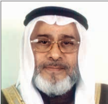
خليفة بن أحمد الظهراني

إنني اليوم لا أكتب عن حضوري الاحتفالية بقدر شهادة للتاريخ لأن الظهراني إضاءة مشرقة في ذاكرة البحرين والخليجين على وجه التحديد وهو العصامي الصلب والنائب والرئيس البرلماني الذي أعطى هذا المجال هيئته، بالإضافة إلى محطات عمله السياسية والاجتماعية والخيرية والتطوعية. نعم.. نفخر به إنسانا متميزا من مملكة البحرين والثابت على الحق وسط التقلبات وحظي بعد هذا كله بثقة ومحبة شعبه لأنه باختصار وقف على مسافة واحدة من الجميع. أبا محمد.. وفيت وكفيت... وتحية تقدير لك من الكويت وجزاك عما قمت به وعملت طوال سنوات حياتك كل خير يا ابن البحرين البار.