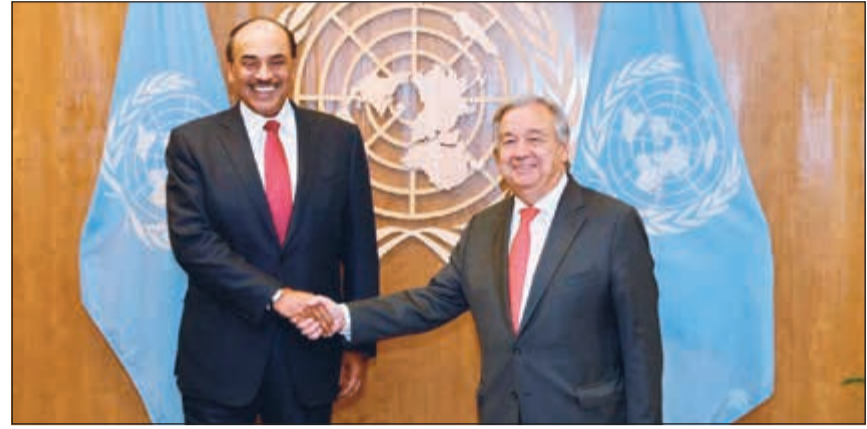
وزير الخارجية الشيخ صباح الخالد خلال لقائه الأمين العام للأمم المتحدة أنطونيو غوتيريس