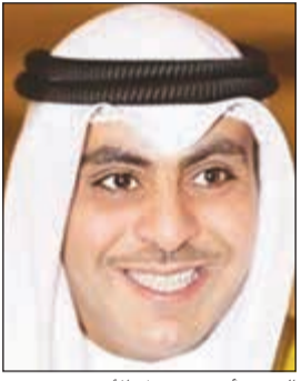
الشيخ أحمد مشعل الأحمد

بموجب مرسوم لسمو نائب الأمير الشيخ نواف الأحمد وبناء على عرض نائب رئيس مجلس الوزراء ووزير الدولة لشؤون مجلس الوزراء، تم تعيين الشيخ أحمد مشعل الأحمد رئيس جهاز متابعة الأداء الحكومي بدرجة وزير، ويعمل بالمرسوم من تاريخ صدوره ونشره بالجريدة الرسمية.