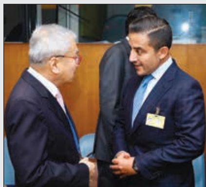
الشيخ د. أحمد ناصر المحمد خلال منتدى التعاون الآسيوي

نيويورك - كونا: شارك مساعد وزير الخارجية لشؤون مكتب نائب رئيس مجلس الوزراء ووزير الخارجية السفير الشيخ د. أحمد ناصر المحمد بأعمال الاجتماع الوزاري لمنتدى حوار التعاون الآسيوي (ACD) الذي عقد يوم الجمعة على هامش أعمال الدورة الـ74 للجمعية العامة للأمم المتحدة في نيويورك. وكان للسفير الشيخ د. أحمد ناصر المحمد مداخلته في أعمال الاجتماع أكد خلالها الأهمية التي توليها الكويت تجاه تعزيز التكامل والتعاون المشترك فيما بين دول الحوار الآسيوي في المجالات الاقتصادية والتنموية المختلفة. وشدد على حرص الكويت تجاه رفع كفاءة الحوار والدفع بها نحو آفاق جديدة تعكس مدى أهمية قارة آسيا بحجمها وتعدادها ومواردها وبما يحقق آمال وتطلعات شعوبها. واستذكر المبادرة السامية من لدن صاحب السمو الأمير الشيخ صباح الأحمد، حفظه الله ورعا، لاستضافة أول قمة للحوار الآسيوي في الكويت، علاوة على احتضانها لمقر الأمانة العامة لحوار التعاون الآسيوي، الأمر الذي يأتي انسجاماً مع سياسة الكويت الخارجية تجاه تعزيز التعاون والتكامل بين دول القارة الآسيوية.