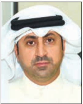
الشيخ نمر الصباح

بموجب مرسوم حمل توقيع سمو نائب الأمير الشيخ نواف الأحمد، وبناء على عرض وزير النفط وبعد موافقة مجلس الوزراء، تم تعيين الشيخ نمر الصباح وكيلاً لوزير النفط بدرجة وكيل وزارة على أن يعمل بالمرسوم من تاريخ صدوره ونشره بالجريدة الرسمية.