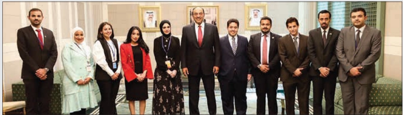
وزير الخارجية الشيخ صباح الخالد خلال لقائه الدبلوماسيين الكويتيين في الأمم المتحدة

وقدم الشيخ صباح الخالد شرحاً عن أهداف السياسة الخارجية الكويتية في المرحلة الحالية والاستحقاقات المستقبلية للكويت على الصعيدين الإقليمي والدولي، كما أكد خلال اللقاء على أهمية إيلاء الدبلوماسيين الحرص على اكتساب المعارف والمهارات اللازمة لخوض