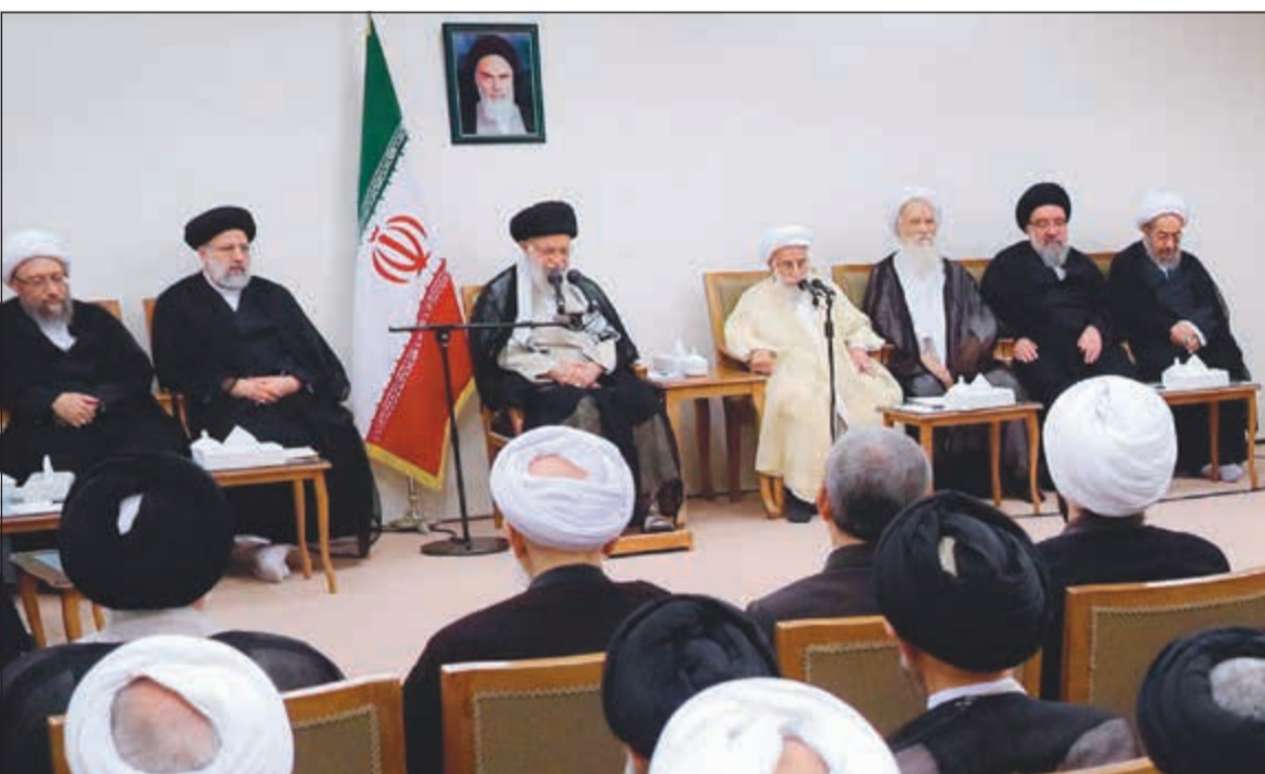
المرشد الأعلى للثورة الإيرانية علي خامنئي متحدثا إلى أعضاء مجلس الخبراء في طهران امس

عواصم - وكالات: بدأ رئيس الوزراء الإسرائيلي بنيامين نتنياهو مهمة تبدو شبه مستحيلة لتشكيل ائتلاف حكومي بعد تكليفه من قبل الرئيس الإسرائيلي رؤوفين ريفلين محاولة القيام بذلك بعدما أفضت الانتخابات إلى طريق مسدود. وحقق نتنياهو من خلال تفويض ريفلين امس الاول له تشكيل الحكومة نصرا مؤقتا وعليه أن يشكل الائتلاف بدون مؤشرات واضحة إلى من سيحصل الأغلبية. وسيحاول نتنياهو النجاح في المهمة الموكلة إليه وهو في انتظار جلسة استماع من المقرر عقدها يومي 2 و3 أكتوبر في مزاعم الفساد المحتملة ضده، والتي دعا نتنياهو، إلى بثها على الهواء مباشرة، قائلا: «حان الوقت لسمع الناس كل شيء»، بما في ذلك جانبي من الرواية». وأضاف: «بالتالي أطلب النائب العام بالسماح ببث الجلسة على الهواء مباشرة، تعلمون أن الشفافية تكشف الحقيقة». وفور تكليفه، دعا نتنياهو مجددا خصمه