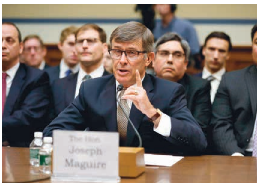
القائم بأعمال مدير المخابرات الوطنية جوزف ماغواير يذلي بشهادته في مجلس النواب

له من أي إجراء انتقامي». وأضاف «لم أستكن عن اتصال الرئيس ترامب بالمخبر وعبرت عن التزامي بحمايته». وأضاف «وافقت على الكشف عن معلومات المكالمة عندما علمت أن الأمر يرقى للحالة الطارئة». وعلى الفور، اتهمت رئيسة مجلس النواب نانسي بيلوسي التي أطلقت إجراء عزل الرئيس ترامب بأنه سعى للتغطية على القضية. وأن إجراءات المسألة التي بدأها الديمقراطيون ستركي على قضية أوكرانيا والقضايا الأخرى التي قد يكون ترامب