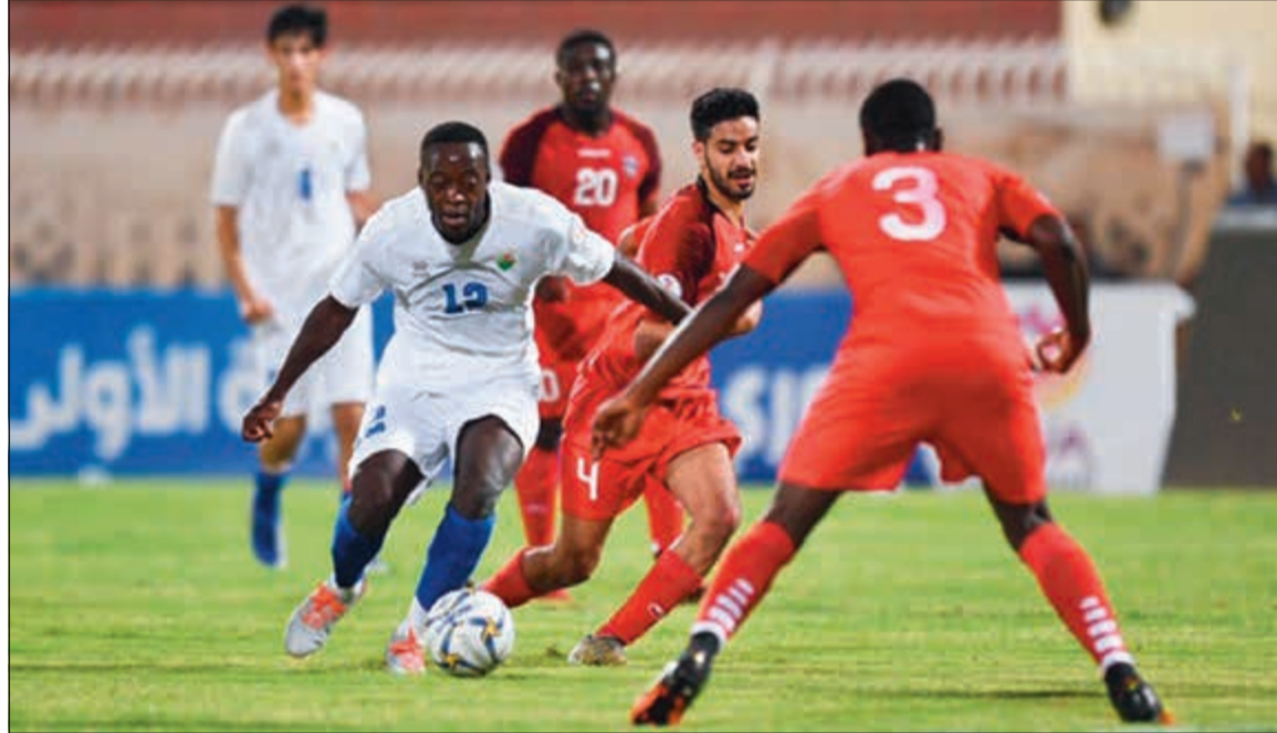
الجهراء والصليبخات لم يتمكنوا من التسجيل

خرج الجھراء والصليبخات بتعادال سليبي دون أهداف في المواجهة التي جمعتها على استاد ناصر العصيمي بنادي خيطان، ضمن منافسات الجولة الثانية لدوري VIVA للدرجة الأولى لكرة القدم، وبهذا التعادل حافظ الصليبخات على الصدارة برصيد 4 نقاط، فيما حصد أبناء القصر الأحمر النقطة الأولى في المسابقة. بسط الجھراء أفضليته منذ بداية الشوط الأول مستفيدا من تراجع الصليبخات واعتماده أفضليته لم تشكل خطورة على مرمي الحارس داود الخالدي حتى الدقيقة (17) التي شهدت اول فرصة حقيقية للتسجيل لكن فقدان المحترف أولسن للتركيز وبقظة الخالدي حالا دون تسجيله للجھراء. وسنحت فرصة ثانية لـ «الجهراوية» للتسجيل بعدما قطع ديمبلي نصف ملعبه وصولا لرمي الصليبخات في الدقيقة (26) بهجمة عسكية