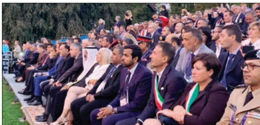
الشيخ أحمد النواف يتقدم الحضور

الدولية في تنظيم أهم الأحداث الرياضية لرفع مستوى الرياضة الشرطة على مستوى العالم. وأضاف أن نجاح النسخة الثالثة من البطولة المقامة حاليا في ميلانو يدعونا إلى تحد أكبر في تنظيم البطولة القادمة التي سيتم الإعلان عن مكان وتوقيت إقامتها خلال الأيام القليلة المقبلة وما لا شك فيه أن زيادة عدد اللاعبين في كل لعبة هو ما نسعى إليه في تطوير البطولات التي ينظمها الاتحاد الدولي مع الاتحادات المنتسبة له والمنظمات الدولية التي تتعاون في نجاح كل تظاهرة.