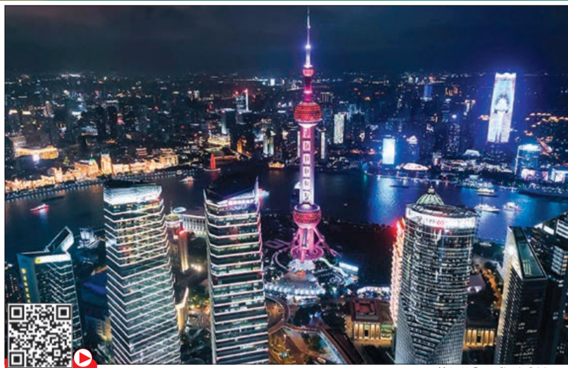
صورة ليلية ملتقطة بـ Mate 30 Pro

أطلقت هواوي أيضا مجموعتها المنتظرة من الأجهزة القابلة للارتداء WATCH GT 2 وتتضمن معالج كيرين المدعم بالكاء الاصطناعي Kirin AI الذي طوره هواوي، وتمتاز WATCH GT 2 ببطارية رائدة ذات عمر طويل، بالإضافة إلى مجموعة شاملة من المزايا والوظائف الجديدة تشمل 15 وضعًا رياضيًا و10 أوضاع خاصة بالتدريب والجري بالأخص، ومشغل موسيقى متقدم وقدرته على إجراء مكالمات صوتية عبر بلوتوث. ويضاف إلى ذلك أن WATCH GT 2 تتمتع بوظائف صحية جديدة تتيح للمستخدم مراقبة معدل ضربات قلب المستخدم وعدد ساعات نومه وغير ذلك من المؤشرات الحيوية. بالإضافة إلى ذلك، أعلنت هواوي عن توافر سماعات الأذن HUAWEI FreeBuds 3 للاتصال اللاسلكي الحقيقي عبر البلوتوث، والتي حصلت على 11 جائزة من وسائل الإعلام بكونها «أفضل ما في إيفاء» خلال معرض الإلكترونيات الاستهلاكية الأخير إيفا 2019.