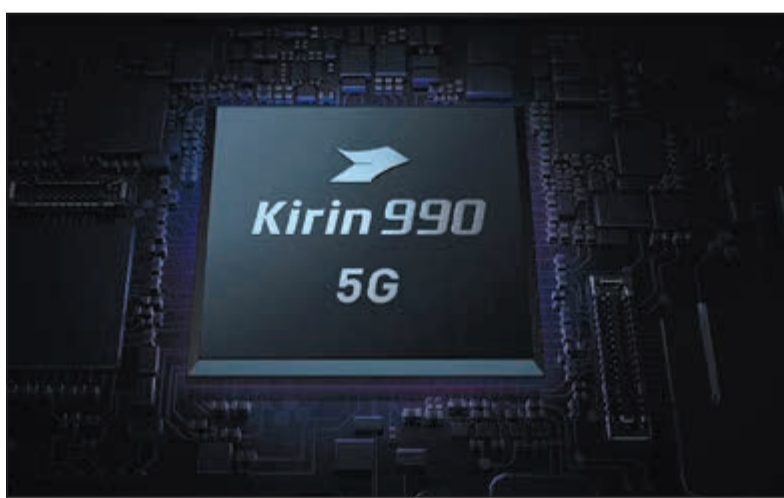
معالج كيرين 990 للجيل الخامس

يتضمن الهاتف Mate 30 نظام الكاميرا الثلاثي مع خاصية SuperSensing التي تشمل كاميرا رئيسية بدقة 40 ميجابكسل، وكاميرا زاوية تصوير عريضة جدا بدقة 16 ميجابكسل، وكاميرا للتصوير البعيد بدقة 8 ميجابكسل. وعندما تعمل هذه العدسات مع معالج الإشارة الرقمية في الجهاز ISP 5.0 فإن هذا الهاتف يمكن المستخدمين من التقاط الصور والفيديو بجودة عالية جدا. أما الهاتف Mate 30 Pro فيتضمن كاميرا رباعية مذهلة مؤلفة من نظام كاميرا سينمائية بدقة 40 ميجابكسل وكاميرا بمستشعر الصورة SuperSensing بدقة 40 ميجابكسل وكاميرا للتصوير البعيد Telephoto بدقة 8 ميجابكسل. وكاميرا لاستشعار العمق ثلاثي الأبعاد. وتكتمل مزايا نظام الكاميرا في الجهاز، بكاميرا التصوير البعيد Telephoto بدقة 8 ميجابكسل مع قدرة التقريب البصري بقوة 3x والتقريب المختلط بقوة 5x والتقريب الرقمي بقوة 30x، بالإضافة إلى ميزة مثبت الصورة الضوئي (AIS) وميزة التثبيت المعتمدة على الكاء الاصطناعي (AIS) وميزة مستشعر العمق ثلاثي الأبعاد للمشهد.