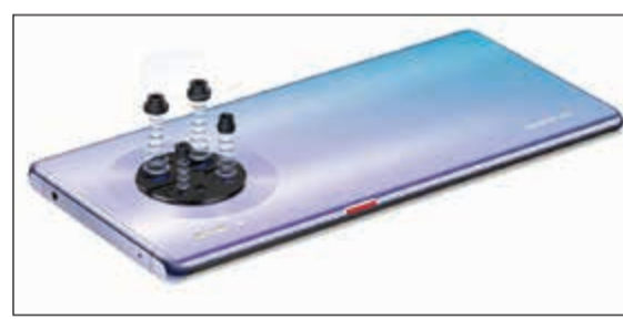
كاميرا رباعية مذهلة مع مستشعر الصورة SuperSensing

تصميم رائع مع هالة حلقيّة يعتمد على المعالج الرائد كيرين 990 للجيل الخامس نظام كاميرا رباعية مذهل يتضمن كاميرا سينمائية متفوقة بمستشعر الصورة