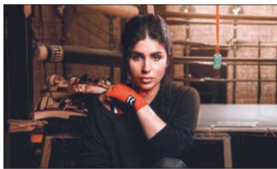
المرأة.. وقلب قوي