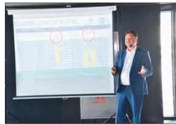
أحد المتحدثين في أنشطة الأسبوع

الوصول الى صفر صافي لانبعاثات الكربون من المبني الأخضر في مراحل التشييد والبناء والتشغيل. وتابع المشعان: يتضمن اسبوع الكويت للمباني الخضراء ثلاث فعاليات أساسية أولاها ثلاث ورش عمل متخصصة تنظمها الأكاديمية الخضراء للزراع التقنية والتعليمية لمجلس