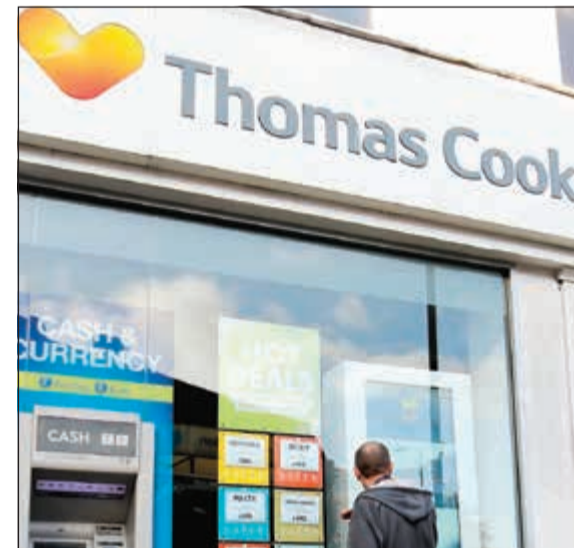
أحد أفرع «توماس كوك»