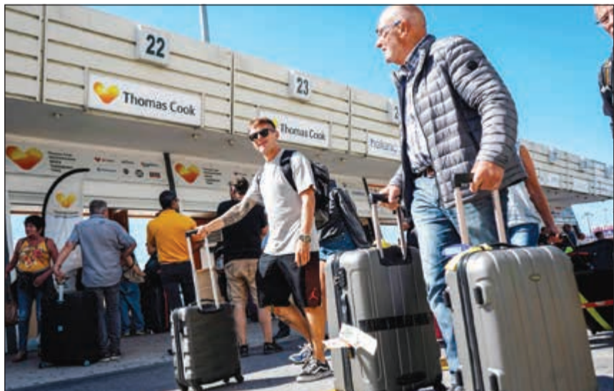
الحكومة البريطانية قد تضطر إلى استئجار طائرات لإعادة مواطنيها إلى البلاد