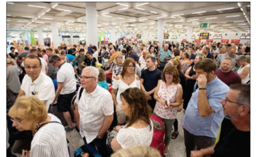
تكدس مئات المسافرين أمس بعد قرار إفلاس «توماس كوك» البريطانية