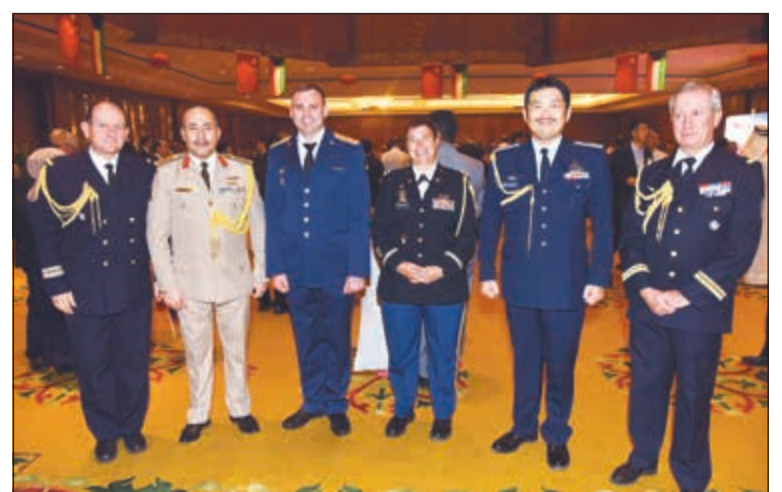
حضور عسكري في الاحتفال