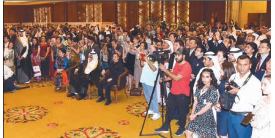
حضور دبلوماسي وشعبي كبير في الاحتفال بالذكرى الـ 70 لتأسيس جمهورية الصين الشعبية

يتبادلان الدعم في القضايا المتعلقة بالهجوم الرئيسية، ويتعاونان عن كثب في مجلس الأمن التابع للأمم المتحدة، وغيرها من المنظمات المتعددة الأطراف. وأوضح أنه في عام 2018 بلغ حجم التجارة الثنائية 18,7 مليار دولار بزيادة سنوية قدرها 5,1%، مبيّناً ان الصين تحتفظ بمكانتها كأكبر مصدر للواردات في الكويت وثاني أكبر وجهة للصادرات الكويتية وأكبر شريك تجاري غير نفطي للكويت.