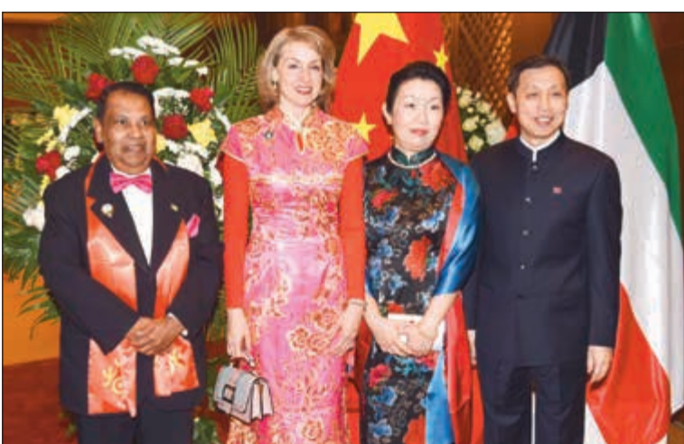
سفير غايانا، د. شامير علي مهنتا