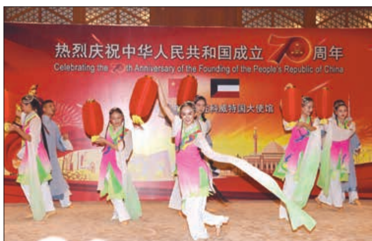
فكرة من الفلكلور الصيني خلال الاحتفال