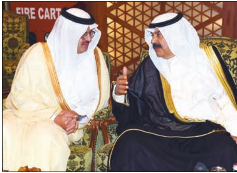
حديث بين خالد الجارالله والسفير السعودي الامير سلطان بن سعد