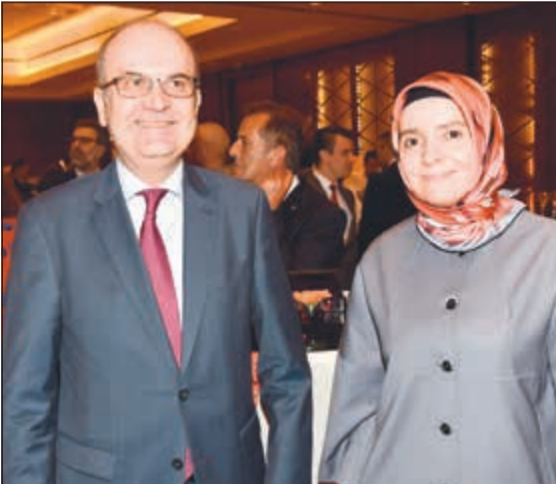
السفيرة التركية خلال مشاركتها في الاحتفال