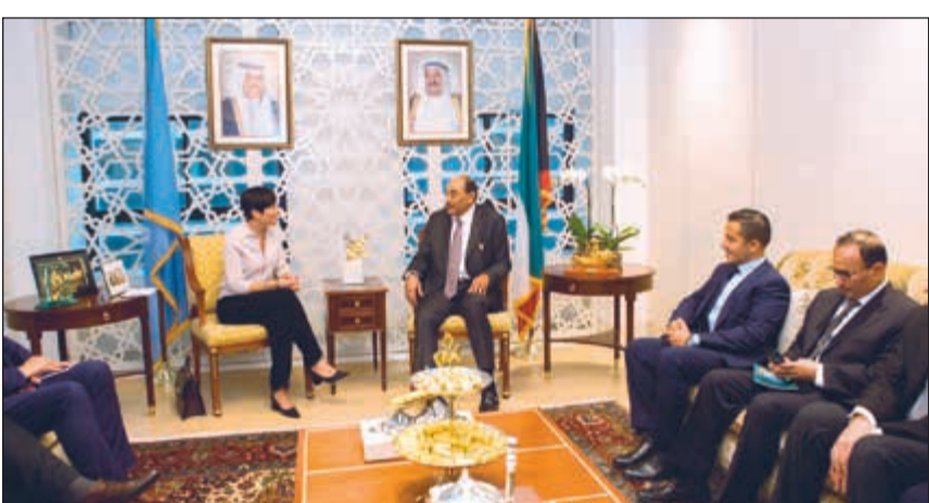
الشيخ صباح الخالد مع وزيرة خارجية مملكة النرويج إيني إيركسن سوريدي

وضم وفد الكويت كلا من السفير الشيخ د.احمد ناصر المحمد مساعد وزير الخارجية لشؤون مكتب نائب رئيس مجلس الوزراء ووزير الخارجية والسفير منصور العتيبي المندوب الدائم لدى الأمم المتحدة في نيويورك وعدد من كبار مسؤولي وزارة الخارجية.