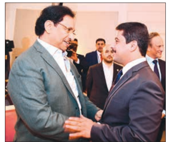
سمو الشيخ جابر المبارك مصافحاً زينفر العازمي

استقبل ممثل صاحب السمو الأمير الشيخ صباح الأحمد، سمو رئيس مجلس الوزراء الشيخ جابر المبارك، وبحضور وزير التربية ووزير التعليم العالي د.حامد العازمي بمقر إقامته في