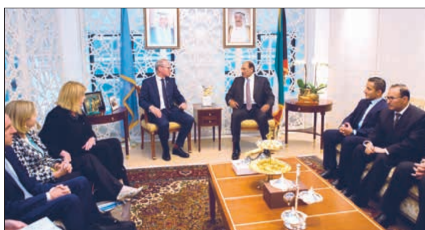
الشيخ صباح الخالد مع وزير خارجية أيرلندا سايمون كوفيني