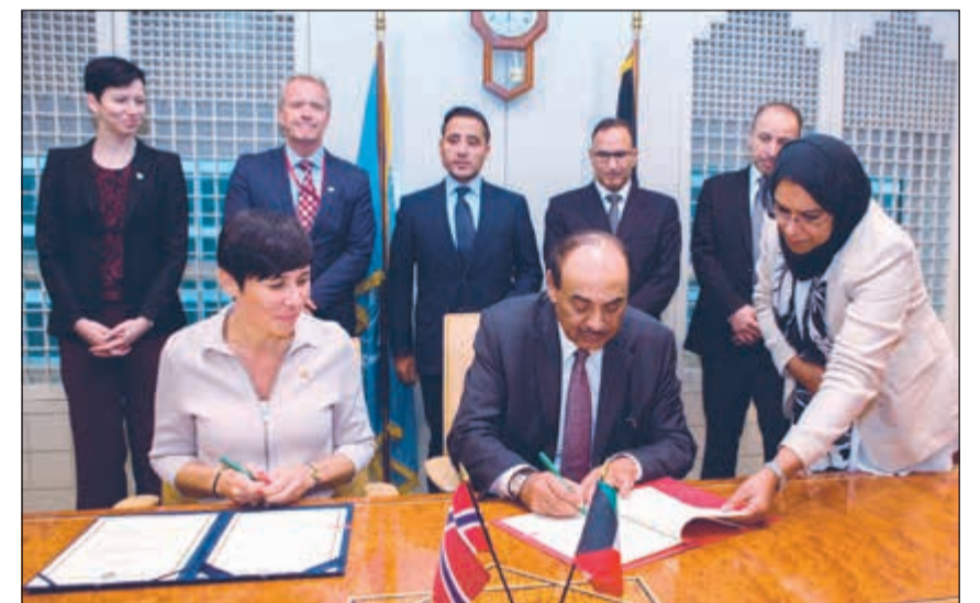
الشيخ صباح الخالد خلال توقيع مذكرات تفاهم مع النرويج

والتعاون الدولي بدولة الامارات العربية المتحدة الشيخ عبدالله بن زايد آل نهيان ووزير خارجية دوقية لكسمبورغ جان اسيلبورن امس الأحد على هامش أعمال اجتماعات الدورة الـ74 للجمعية العامة للأمم المتحدة في نيويورك.