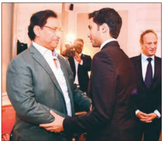
سمو الشيخ جابر المبارك مصافحاً علي الغانم