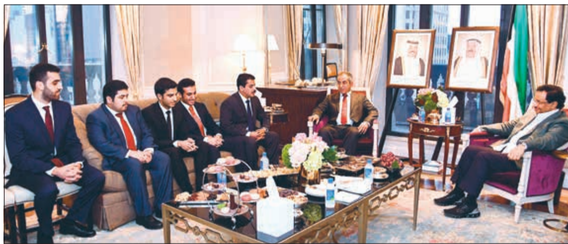
سمو الشيخ جابر المبارك خلال اللقاء مع الطلبة