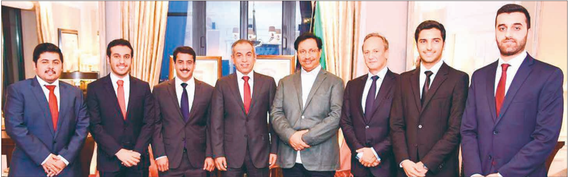
سمو الشيخ جابر المبارك متوسلاً د.حامد العازمي والسفير الشيخ سالم العبدالله وزينفر العازمي وخليفة الشحومي وعلي الغانم واسامة الديحاني وعلي نظر