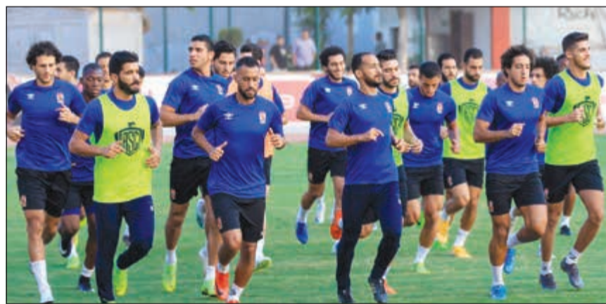
استعدادات قوية في الأهلي لمباراة السوبر أمام الزمالك غدا