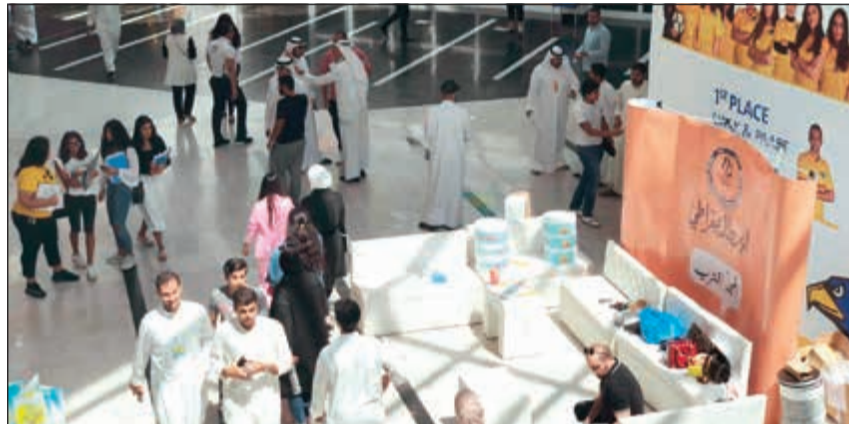
الطلبة تواجداً منذ الصباح الباكر للمشاركة

أكد استعداد العمادة للعملية الانتخابية بالجمعيات العلمية اليوم