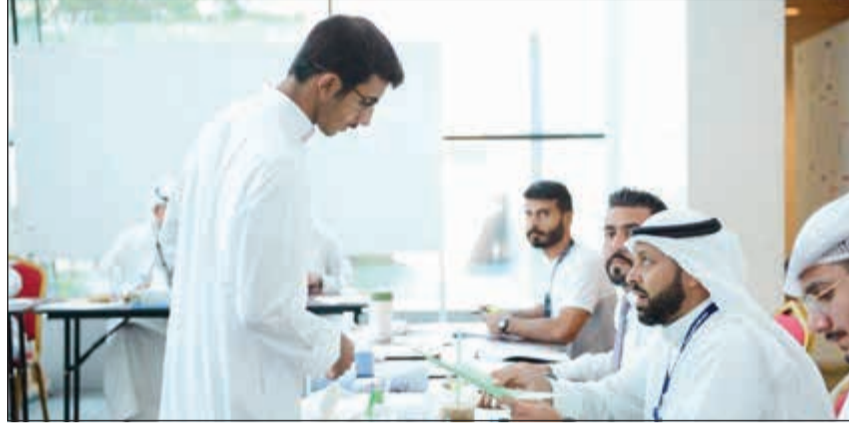
جانب من العملية الانتخابية

وأضاف الكندري أن ثقة الجموع الطلابية هي مدعاة للفخر وأمانة حملها الطلبة لنا طيلة 17 عاماً، واعدوا إياهم بالاستمرار في مسيرة خدمة الطلبة في حال فوزهم بالانتخابات.