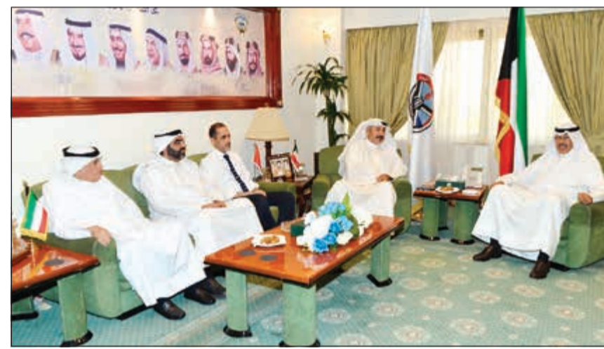
الشيخ فواز الخالد مستقبلاً قيادات المنطقة الصحية

الجوهريّة والحيوية بالغة الأهمية التي سيتم مباشرة العمل بشأنها فوراً وسيترتب عليها الارتقاء بمستوى الأداء في مختلف المرافق الصحية وتجاوز العديد من السلبيات، وتسليط الضوء على الإيجابيات والإنجازات التي يحققها القطاع الصحي. من جانبه، أعرب د.أحمد الشطي عن سعادته باللقاء، لافتاً إلى أن المشروع التنموي «محافظة أجمل» الذي أطلقته محافظة الأحمدية نجح في التواصل مع شرائح المجتمع المختلفة في مناسبات عديدة، لافتاً إلى أن اللقاء تطرق إلى خصوصية محافظة الأحمدية حيث أن منطقة الأحمدية الصحية هي الأكبر من حيث المساحة الجغرافية.