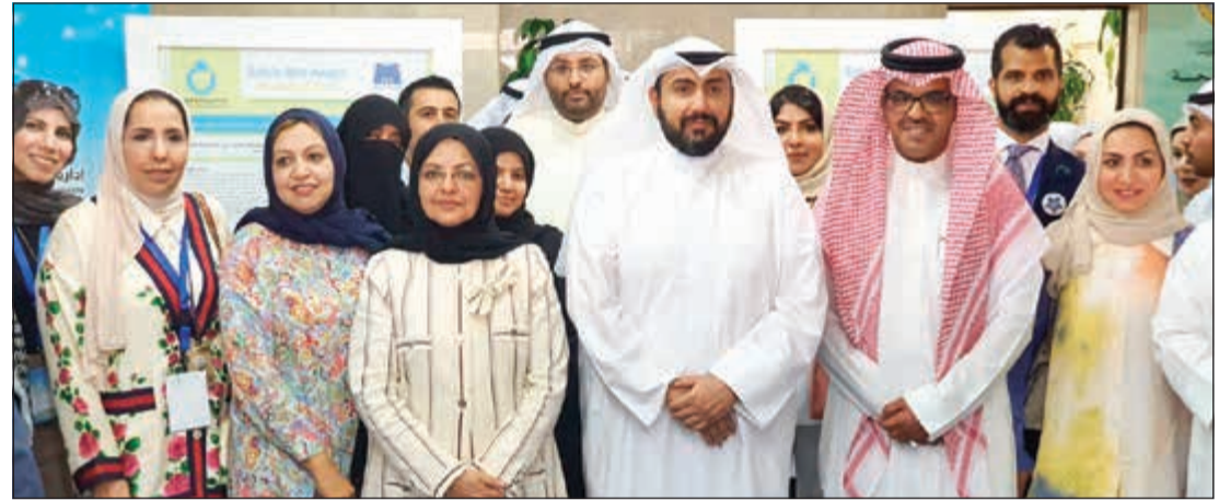
الشيخ دباسل الصباح وعدد من حضور الاحتفال في لقطه جماعية

جميع المستويات، أن البرنامج هو برنامج عالمي تحتفل به دول العالم مع منظمة الصحة العالمية. لافتا الى ان هذه البرامج الخاصة بسلامة المرضى أظهرت أرقاماً مبهرة في تحسين مستويات الخدمة وسلامة المرضى بشكل واضح. وأشار إلى أن إدارة الجودة والاعتراف في الوزارة تسعى إلى اختيار البرامج الناجحة لتطبيقها على أرض الواقع، مؤكداً في الوقت نفسه ان الأونة الأخيرة شهدت إنشاء إدارة جديدة للمسؤولية الطبية وهي مستقاة من قانون