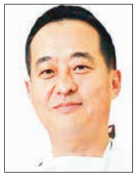
البروفيسور Gun Choi