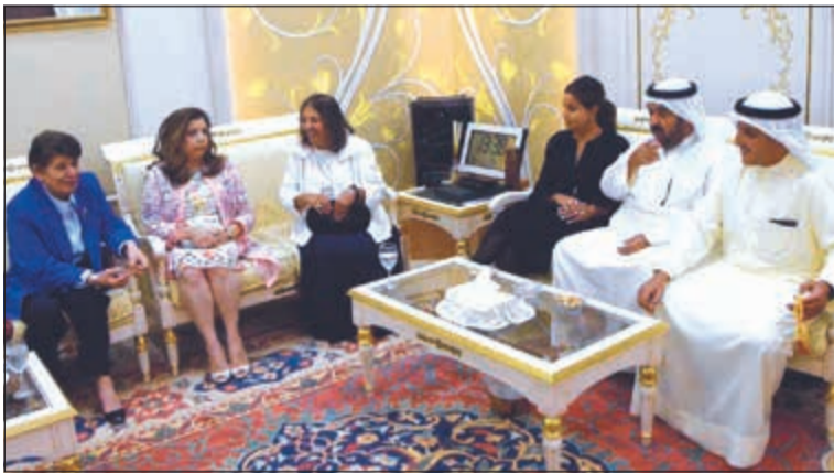
الشيخ د.احمد ناصر المحمد والشيخ خالد البدر ونبيلة الملا و.درشا الصباح وعدد من الحضور

■ موقف الولايات المتحدة من الغزو الغاشم سيظل محفوراً في ذاكرة الأجيال وفي تاريخ الكويت وعلاقتنا الدبلوماسية من أقدم العلاقات ■ صديقنا الذي نودعه اليوم هو مزيج من الخبرات المتميزة التي انصب معظمها على القضايا المتعلقة بالإصلاح السياسي والاقتصادي