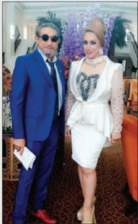
.. ومع الفنان العراقي باسم قهار

الوطن العربي يعاني منها، وهي تتعلق بتحضيرات الزواج التي يصرف عليها البعض الآلاف حتى يميز