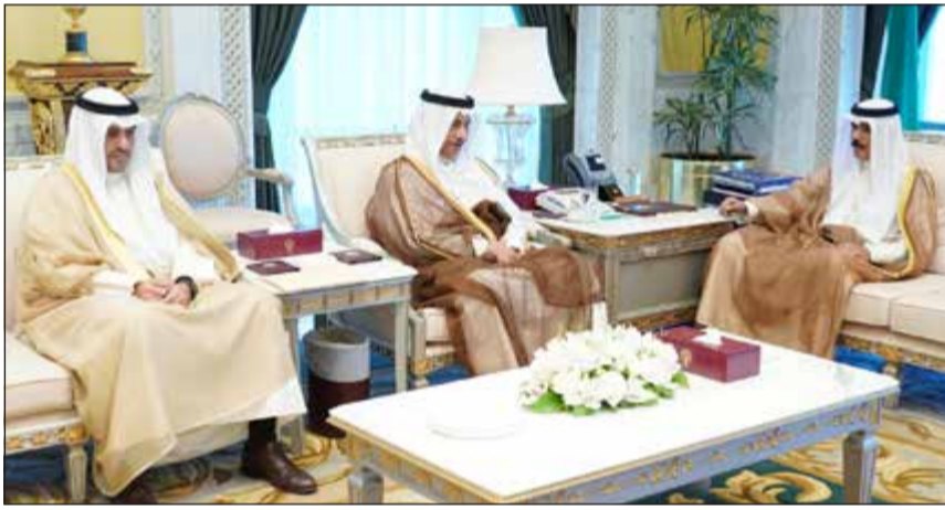
سمو نائب الأمير مستقبلاً سمو الشيخ جابر المبارك وأنس الصالح