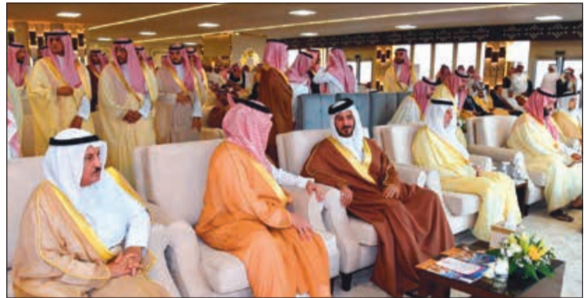
ممثل النائب الأول لدى حضوره الحفل الختامي للمهرجان بحضور صاحب السمو الملكي الأمير محمد بن سلمان

شراء الحفل الختامي لمهرجان ولي العهد للهجن والذي أقيم في مدينة الطائف بالملكة العربية السعودية الشقيقة.