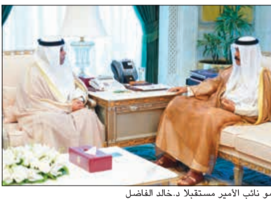
سمو نائب الأمير مستقبلاً دخال الفاضل

حضر ممثل النائب الأول لرئيس مجلس الوزراء ووزير الدفاع الشيخ ناصر صباح الأحمد المستشار بالديوان الأميري محمد