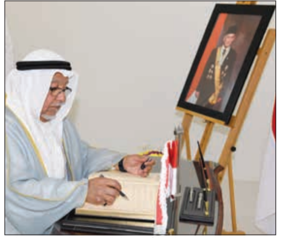
الشيخ علي الجراح ينقل تعازي الأمير بوفاة الرئيس السابق لإندونيسيا

قام وزير شؤون الديوان الأميري الشيخ علي الجراح بزيارة إلى سفارة جمهورية إندونيسيا الصديقة لدى الكويت، حيث نقل تعازي صاحب السمو الأمير الشيخ صباح الأحمد، وسمو نائب الأمير وولي العهد الشيخ نواف الأحمد، وسمو الشيخ جابر المبارك رئيس مجلس الوزراء، وحكومة وشعب الكويت، وذلك بوفاة الرئيس السابق لجمهورية إندونيسيا بحر الدين يوسف حبيبي.