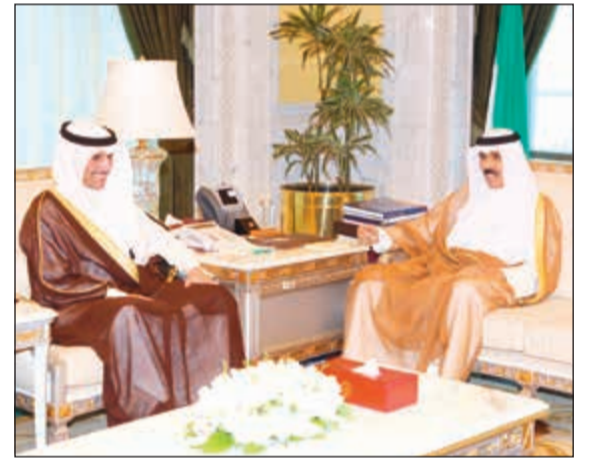
سمو نائب الأمير وولي العهد الشيخ نواف الأحمد خلال استقباله مرقوق الغانم