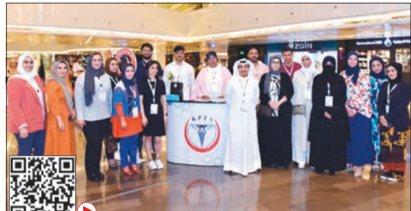
الشاركون في حملة الأمل المزمن

الذي يضم في عضويته الكويت كعضو فعال، ويتم تعميمه على جميع دول العالم في يوم يقوم اختصاصو العلاج الطبيعي بنشر الوعي للامة عن دورهم وتوضيح دور العلاج الطبيعي في شتى المجالات. وذكرت أنه في هذا العام يتم تسليط الضوء على دور العلاج الطبيعي مع الأمل المزمن، حيث يساهم اختصاصو العلاج الطبيعي في ابراز آية التعامل مع الأمل المزمن عن طريق الحفاظ على الرونة والحركة، وتحسين صحة القلب، وبناء والحفاظ على الكتلة العضلية، وتحسين المزاج والصحة العامة، والمساعدة في السيطرة على الألم، فضلاً عن زيادة الثقة للمشاركة في الأنشطة المختلفة، واستعادة السيطرة على الحياة والحد من الخوف.