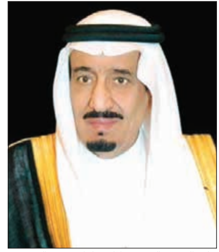
خادم الحرمين الشريفين الملك سلمان بن عبدالعزيز

وذكرت وكالة الأنباء السعودية الرسمية (واس) في بيان أن خادم الحرمين أكد أن هذا الإعلان يعد تصعيدا بالغ الخطورة بحق الشعب الفلسطيني، وانتهاكا صارخا لميثاق الأمم المتحدة والأعراف الدولية، وأن المحاولة الإسرائيلية لفرض سياسة الأمر الواقع لن تطمس الحقوق الثابتة للشعب الفلسطيني. وقالت وكالة الأنباء الفلسطينية الرسمية (وفا) إن خادم الحرمين أكد أن الإعلان الإسرائيلي بضم الأراضي الفلسطينية باطل ولاغٍ، مشيرا إلى البيان السعودي المهم الذي أكد أن ذلك يمثل خرقا وانتهاكا للقانون الدولي، وأن أي محاولة لفرض الأمر الواقع على حساب الشعب الفلسطيني ستكون مرفوضة.