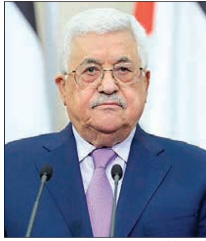
الرئيس الفلسطيني محمود عباس

من جهته، ثمن الرئيس محمود عباس حرص واهتمام خادم الحرمين الكبير بالقضية الفلسطينية، ومواقف المملكة الدائمة والثابتة والحازمة تجاه فلسطين وشعبها في مختلف القمم والمحافل الإقليمية والدولية. وفي سياق متصل، دعا العامل الأردني الملك عبدالله الثاني إلى تكاتف دولي لرفض كل الإجراءات الإسرائيلية الخاطئة الجانبة التي من شأنها «تقويض حل الدولتين». وقال الديوان الملكي في بيان