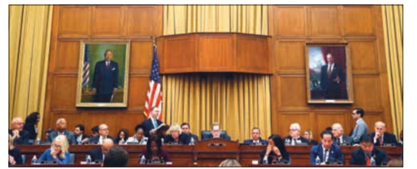
اللجنة القضائية تصادق بالإجماع على قرار يسهل مستقبلا البدء في إجراءات عزل ترامب (أ.ف.ب)

الإيراني حسن روحاني. وفي السياق ذاته، أفاد تقرير اخباري بأن ترامب ترك انطباعا بأنه يفكر بجدية في مقترح الرئيس الفرنسي إيمانويل ماكرون لتوفير خط ائتمان بقيمة 15 مليار دولار للإيرانيين بضمنان النفط، إذا ما عادت طهران إلى الامتثال للاتفاق النووي الذي وقع في عهد سلفه باراك أوباما. من جهة أخرى، منحت المحكمة العليا