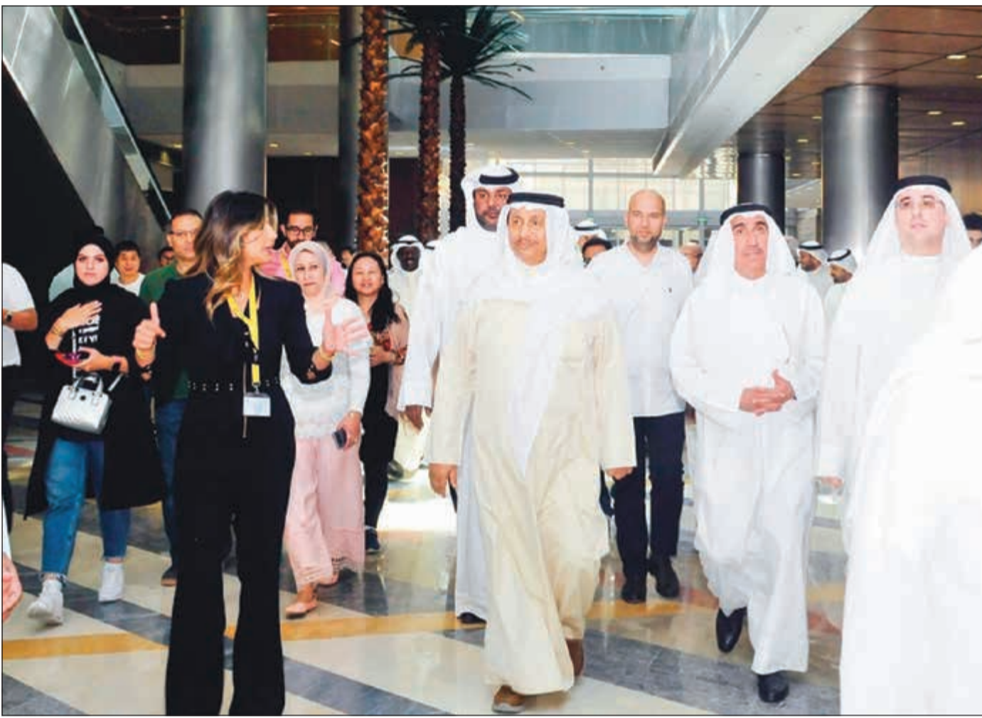
سمو رئيس الوزراء الشيخ جابر المبارك خلال زيارته إلى مبنى الحرم الجامعي الجديد في مدينة صباح السالم الجامعية

رئيس الوزراء تفقد الحرم الجامعي الجديد في الشداية واستمع إلى شرح عن كيفية انتظام الدراسة بالكليات 03