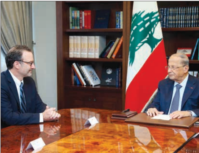
الرئيس العماد ميشال عون مستقبلا مساعد وزير الخارجية الأميركي لشؤون الشرق الأدنى ديفيد شنكر

توقفت مع ديفيد ساترفيلد، لاسيما ان تقاطعا عدة تم الاتفاق عليها ولم يبق سوى القليل من النقاط العالقة في بنود التفاوض. وجدد عون التأكيد على التزام لبنان بقرار مجلس الأمن رقم 1701 في حين ان إسرائيل لا تلتزم به وتواصل اعتداءاتها على السيادة اللبنانية في البر والبحر والجو، علما ان اي تصعيد من قبلها سيؤدي الى إسقاط حالة الاستقرار التي تعيشها المنطقة الحدودية منذ حرب تموز 2006. وأشار الى ان لبنان ماض في تسهيل عودة النازحين السوريين الى بلادهم، وان عدد العائدين اراديا بلغ حتى الآن 352 ألف نازح لم يواجهوا اي مشاكل، داعيا الولايات المتحدة الى ان تساعد لبنان في تسهيل عودة النازحين الى اراضيهم، لأن لبنان لم يعد قادرا على تحمل المزيد من التبعات السلبية التي طاولت كل القطاعات اللبنانية نتيجة تزايد اعدادهم. وأكد عون على ضرورة تقديم منظمات الأمم المتحدة والهيئات الانسانية الاخرى مساندة الى النازحين داخل سورية لأن ذلك يساعد في عودتهم الى قراهم وارضهم، واعرب عن خشيته من ان يكون موضوع النازحين السوريين قد تحول الى مسألة سياسية يجري استغلالها بدلا من التعاطي معها من زاوية انسانية.