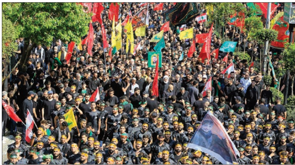
مسيرة حاشدة لحزب الله في الضاحية الجنوبية لبيروت بمناسبة ذكرى عاشوراء (محمود الطويل)

انتهج بيروت امس بالوسيط الأميركي الزائر ديفيد شنكر الساعي لاستكمال مهمة سلفه ديفيد ساترفيلد في ترسيم الحدود البرية والبحرية بين لبنان وإسرائيل. شنكر الذي يتحدث العربية بطلاقة وسبق له ان عمل لدى السفارة الأميركية في بيروت التقى رئيس الحكومة سعد الحريري فور وصوله الإثنين الماضي، وصباح امس استقبله رئيس الجمهورية العماد ميشال عون، وظهر التقاء رئيس مجلس النواب نبيه بري المشرف على هذا الملف، وقد ابلغه بري ان الاقتصاد اللبناني والقطاع المصرفي لا يستطيعان تحمل ضغوط العقوبات، وأكد التزام لبنان بالقرار 1701. وقال بيان السفارة الأميركية في بيروت ان شنكر يقوم بجولة اقليمية تشمل لبنان والعراق وسورية والأردن بهدف التأكيد على العلاقات الثنائية وعلى الالتزام بالعمل مع الشركاء والحلفاء على الاستقرار في الشرق الاوسط وشمال افريقيا. وفي السياق، ابلغ الرئيس ميشال عون شنكر امس ان لبنان يأمل في ان تستأنف اللوائح المتحصدة الأميركية وساطتها للتوصل الى ترسيم الحدود البرية والبحرية في الجنوب من حيث