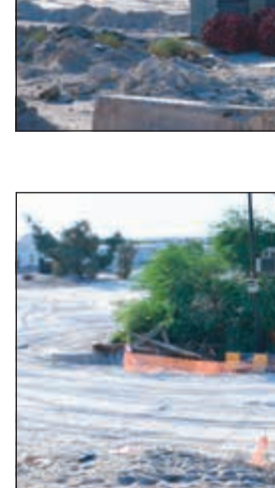
الانتهاء من الخزانات نوفمبر المقبل

حدوثها في الموسم القادم) وذلك لتأمين سلامة الطرق ومرتادي الطرق والمناطق المحيطة بهذين الموقعين لما تسببها من كوارث وأضرار