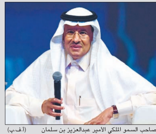
صاحب السمو الملكي الأمير عبدالعزيز بن سلمان

عبدالعزيز بن سلمان: ماضون في «النووي».. ولا تغيير في سياسة النفط السعودية