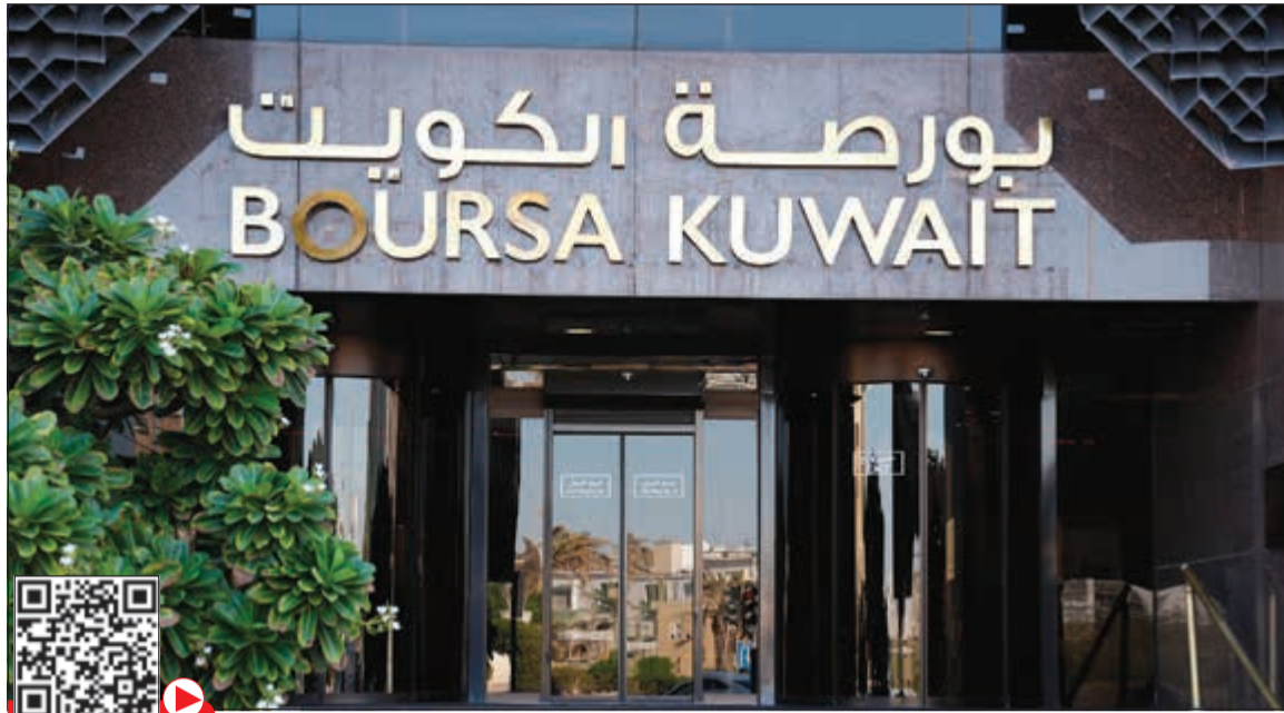
البورصة تبدأ رحلة طرح 150 من أسهمها للاكتتاب العام