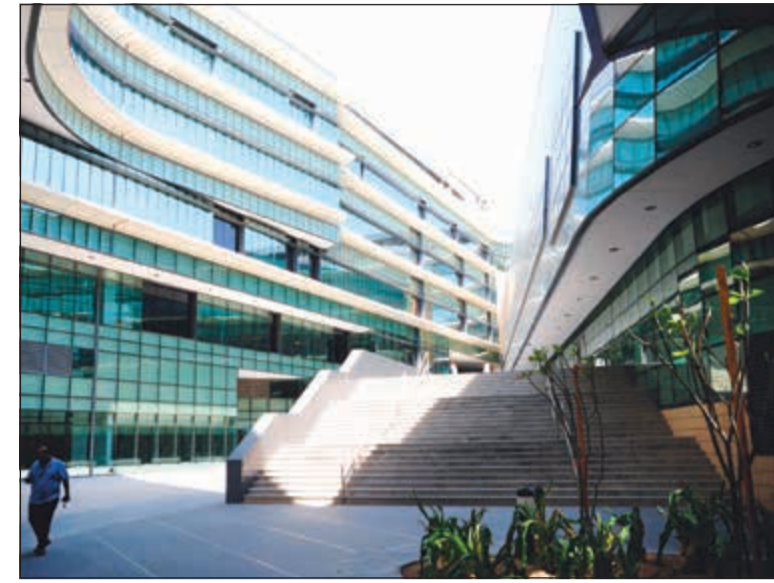
البحر الجامعي للمدينة الجامعية يضيء أرقى الجامعات في العالم