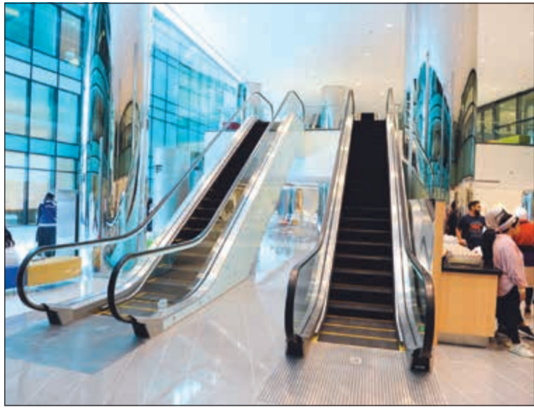
الإدارة حرصت على التأكد من توافر جميع المرافق اللازمة للطلبة وأعضاء هيئة التدريس