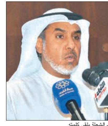
فهد الشعلة يلقي كلمته

بلا استثناء وللكويت على وجه الخصوص بلا تردد. واختم الشعلة قائلاً: إن وزارة الأوقاف والشؤون الإسلامية تتقدم بالشكر لجميع الوزارات والمسؤولين والرؤساء الفرق المشاركة في خدمات الحج على التعاون وتكاتف الجهود والمساهمة في النجاح، سائلاً الله سبحانه وتعالى أن يديم علينا نعمة الامن والأمان في كويتنا الغالية، تحت راية صاحب السمو الأمير الشيخ صباح الأحمد، وسمو ولي عهده الأمين والحكومة الرشيدة، داعياً للمولى عز وجل أن يفيينا على ما أولانا من خدمة عباده، وأن يجيبنا إلى بعضنا لتكون متعاونين على البر والتقوى، متعاضدين في السر والنجوى.