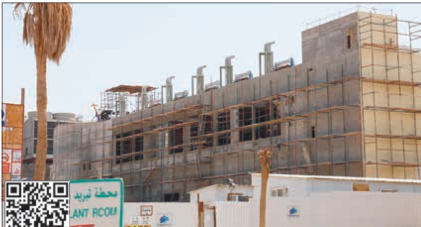
من أعمال إنشاء مبنى مستشفى الصباح

حيث سيتم تخصيص 117 سريراً للطوارئ، وعلى الرغم من أن المبنى يظهر كأنه ثلاثة مبان، إلا أنه مدخلين على أن يكون أحدهما للزوار والآخر للطوارئ. العيادات الخارجية ويضم المستشفى للجراحة، بينما خصص المبنى الرئيسي للعمليات مع 22 غرفة عمليات، وثلاث MRI وأثنى CT. أما فيما يخص بالمواقف فإن المبنى الرئيسي مخصص له 1200 سيارة، وكذلك 200 سيارة