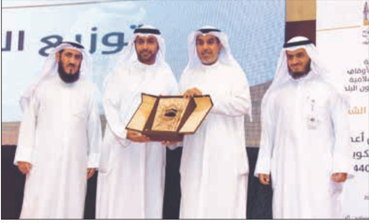
جانب من تكريم بعثة الحج الكويتية (زين علام)