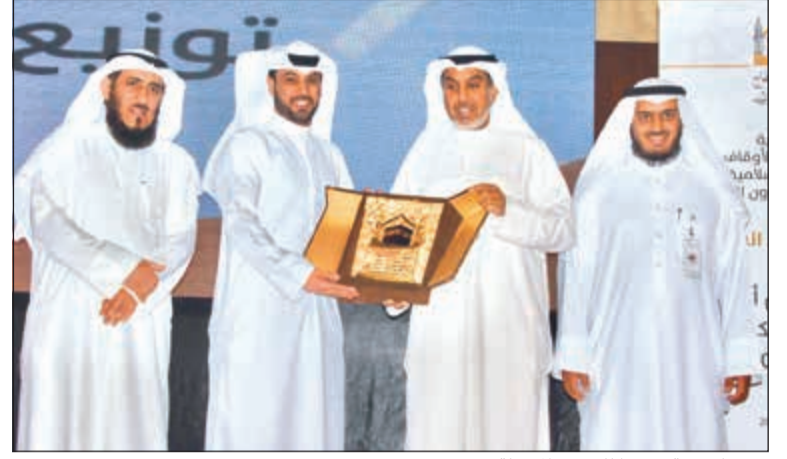
درع تكريمية تقديرا للجهود المبذولة