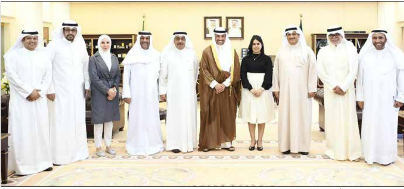
الرئيس مرزوق الغانم متوسلاً وفد جمعية الصحفيين بحضور النواب محمد الدلال وصلاح خورشيد وحمد الهرشاني وفيصل الكندري