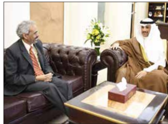
الرئيس الغانم مستقبلاً سفير جمهورية الهند جيفا ساغار