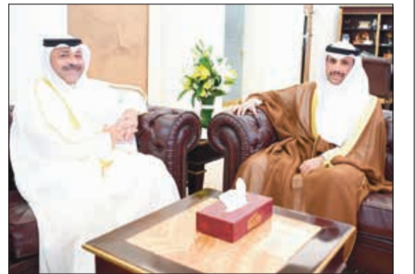
رئيس مجلس الأمة مرزوق الغانم خلال استقباله مشعل مصطفى الشمالي