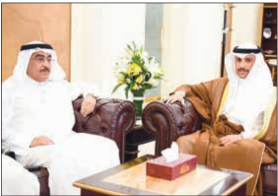
الغانم مع أمين سر جمعية الصحفيين ورئيس لجنة شؤون المهنة الزميل عدنان الراشد

استقبل رئيس مجلس الأمة مرزوق الغانم مكتبه أمس وفد لجنة شؤون المهنة بجمعية الصحفيين الكويتية برئاسة رئيس اللجنة عدنان الراشد. وضم الوفد الصحفي أعضاء اللجنة عددا