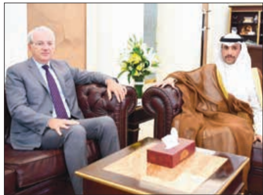
الغانم مع سفير جمهورية اليونان أندرياس باباداكيس